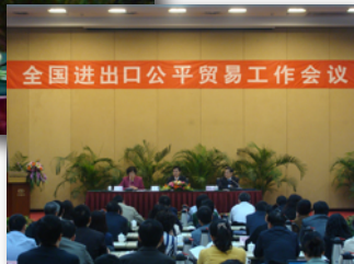
商务部副部长 钟山出席全国进出口公平贸易工作会议并讲话

商务部进出口公平贸易局周晓燕局长在工作报告中全面总结和回顾了入世十年来我国公平贸易工作取得的成绩。报告指出，贸易摩擦应对和贸易救济调查工作在积极营造良好外部环境、依法维护产业安全方面取得显著成效，为建立和完善内外联动、互利共赢、安全高效的开放型经济体系做出了重要而独特的贡献，今后较长一段时期我国面临的贸易摩擦和产业安全形势仍极为严峻，为此，公平贸易工作要认真贯彻落实钟山同志的讲话精神，在形势发展变化中捕捉新机遇，在国际国内互动影响中把握主动权，统筹考虑和妥善处理稳定出口与维护环境、扩大进口与保护产业的关系，不断开创贸易摩擦应对和贸易救济调查工作的新局面。