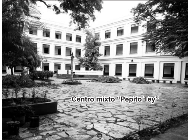
Centro mixto "Pepito Tey"

Estos centros surgen a partir de la necesi-