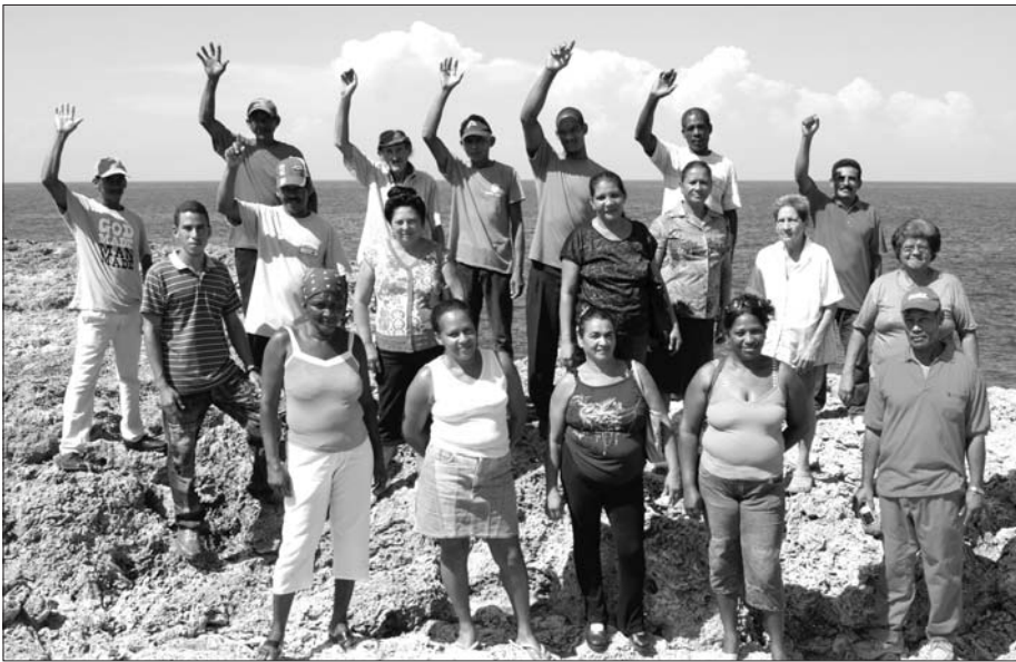
Parte de los integrantes del Destacamento de Juraguá en uno de los difíciles puntos donde desarrollan la vigilancia