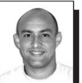
A cargo de JORGE R. MATOS CABRALES

Así queda lista la escena para la última jornada de un evento que ha reunido a lo más competitivo de la escena mundial en el atletismo, amén de las lagunas por la falta de buenos tiempos en la pista y las legendarias descalificaciones de algunos astros del espectáculo.