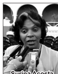
Surina Acosta "A Fidel, a Raúl: las mujeres cubanas no los defraudaremos"