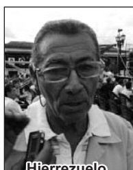
Hierrezuelo "La Revolución siempre en nuestros corazones"