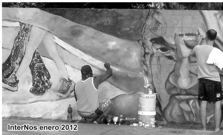
InterNos enero 2012