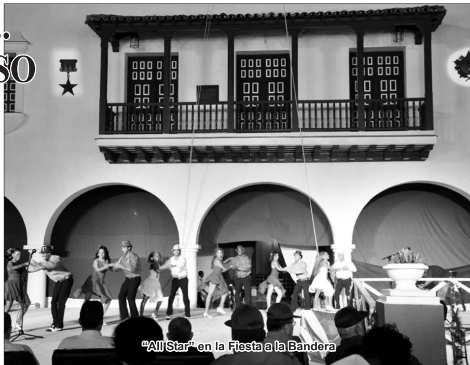
"All Star" en la Fiesta a la Bandera