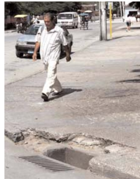
Peligro para los transeúntes es este tragante sin rejilla, en calle Habana esquina a Maceo.