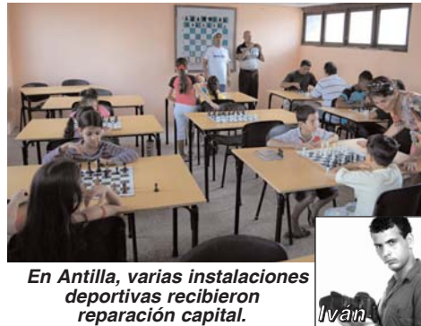
En Antilla, varias instalaciones deportivas recibieron reparación capital.