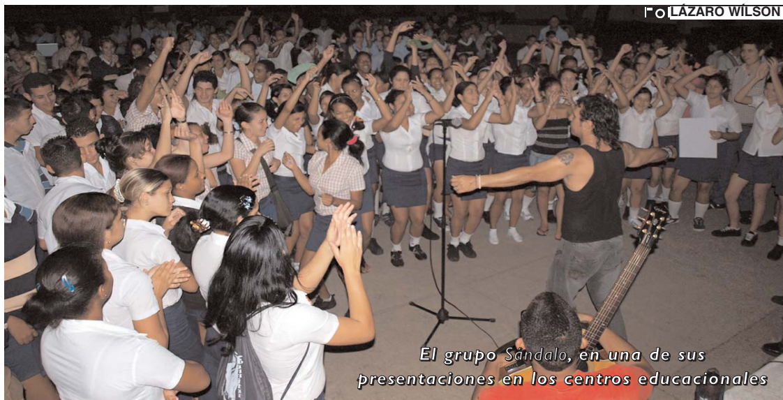
El grupo Sándalo , en una de sus presentaciones en los centros educativos