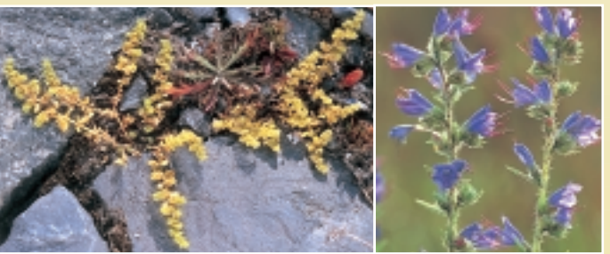
Kaal breukkruid Slangenkruid

De opgespoten bodem van 'De Sashul' bestaat voornamelijk uit schelpen- en dus kalkrijk zand. Het, weliswaar kunstmatig, fysisch milieu van 'De Sashul' vertoont bijgevolg veel gelijkenis met het natuurlijk fysisch milieu van de jonge, kalkrijke kustduinen. Dit komt duidelijk tot uiting in de begroeiing. De ondiepe depressies, die tijdens winter en lente meestal blank staan maar tijdens de latere zomer droog vallen, herbergen pioniervegetaties die in vochtige duinvalleien thuishoren. Zo kun je er o.a. Sierlijke vetmuur, Fraai duizendguldenkruid en Waterpunge aantreffen, alsook soorten die herinneren aan de zoute oorsprong van het opgespoten zand: Zeevetmuur, Aardbeiklaver, Hertshoornweegbree en Zeeaster . De matig tot zeer droge ruggtjes zijn bedekt met duingraslandvegetaties van o.a. Kandelaartje, Scheve hoornbloem, Kleine leeuwetand, Duinlangbaardgras, Knolbeemdgras, Gewone rolklaver, Scherpe fijnstraal, Ruwe klaver en Blauw walstro . Deze matig vochtige tot droge duingraslandjes bezitten ook al een aardige paddenstoelenflora met o.a. verscheidene soorten fel gekleurde wasplaten . Een buitenbeentje is het Kaal breukkruid , een kalkminnend plantje dat