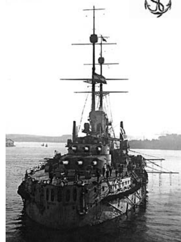
Potopenie Szent István