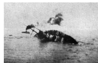
Potopenie Szent István

Prakovčania mali veľké šťastie a všetci sa zachránili. Námorníkov stiahli späť do Puly. Po skončení vojny sa rozpadla monarchia a vznikol Československý štát. Námorníci boli rozpustení a vrátili sa domov. Dedo bol na vojne spolu šesť rokov,