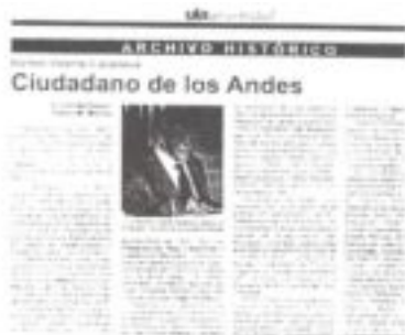
Columna Archivo Histórico del periódico ULAuniversidad N° 2 junio de 2003, p. 5.

Luego de cuatro meses de interrupción ocasionada por la situación política que se presentó en el país a partir de diciembre de 2002, lo cual afectó el normal funcionamiento de las universidades, reapareció el periódico ULAuniversidad , (N° 20, mayo 2003) vocero oficial de nuestra máxima Casa de Estudios, y en él la columna “Archivo Histórico”, redactada en nuestra dependencia y relacionada con la historia de nuestra máxima Institución y de sus personajes más resaltantes. Al respecto, en el N° 21, junio 2003, hemos publicado la biografía titulada “Ramón Vicente Casanova. Ciudadano de los Andes”, en la cual hacemos una reseña de este eminente intelectual, recientemente fallecido (26 de enero de 2003), quien además de Rector de nuestra Universidad fue un destacado agrarista, escritor, político y educador, cuya obra ha quedado como testimonio de su identificación con esta tierra venezolana y con su gente.