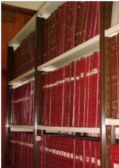
AHULA. Libros de la Serie Expedientes de Grados . 1923-1947

El diseño de esta política puede ser una meta de mediano plazo, sin embargo debe iniciarse con prontitud. Es un reto que tienen ante sus ojos las Autoridades y por el cual en un futuro no muy lejano habrán de dar cuenta a la comunidad universitaria y a la colectividad en general. Por ahora la necesidad más inmediata y urgente a resolver es la de dotar al actual Archivo Histórico (AHULA) del espacio que requiere para funcionar, sin el cual no puede cumplir cabalmente con su misión fundamental de recibir, rescatar, organizar y dar a conocer el patrimonio documental histórico de la Universidad.