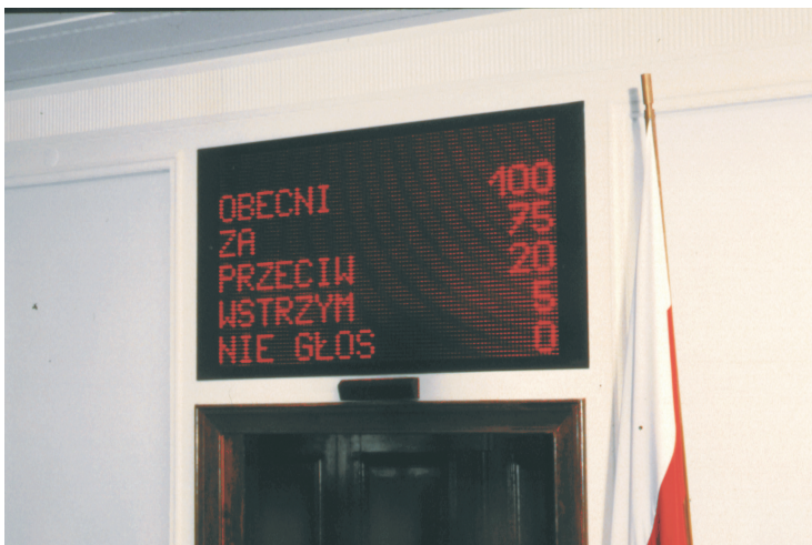
Результаты голосования на табло