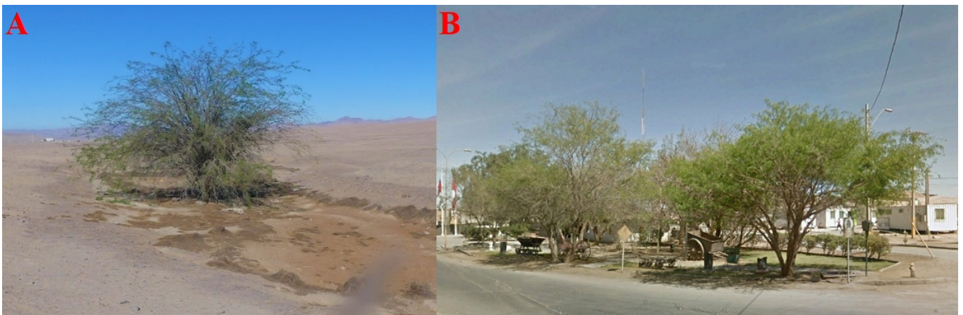
Figura 2: Ambientes en Baquedano donde se registraron los dos individuos de Microlophus theresioides . A) Sitio con presencia de Prosopis sp., B) Plaza de Baquedano. Figure 2: Environments in Baquedano where the two individuals of Microlophus theresioides were recorded. A) Site with the presence of Prosopis sp., B) Plaza de Baquedano.

Baquedano ( 23^{\circ} 19' 55,92'' S, 69^{\circ} 50' 23,79'' O), donde dominan los Prosopis (Fig. 2B), y que generan un microclima por su sombra. El segundo ejemplar, algo más pequeño que el primero, se observó en comportamiento de persecución de dípteros, aprovechando rocas y jardines del sector. A esta pequeña área verde artificial llegan muchos insectos, presas ideales para un lagarto como M. theresioides .