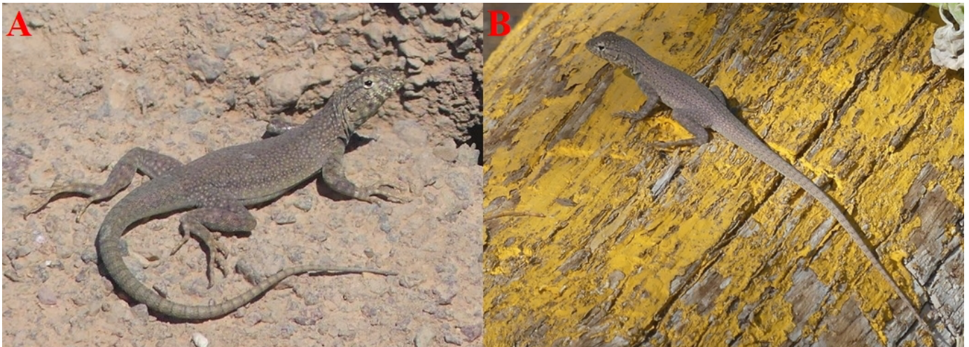
Figura 1: Ejemplares de Microlophus theresioides registrados en Baquedano. A) individuo 1 (subadulto), B) individuo 2 (juvenil). Figure 1: Specimens of Microlophus theresioides recorded in Baquedano. A) individual 1 (juvenile), B) individual 2 (subadult).