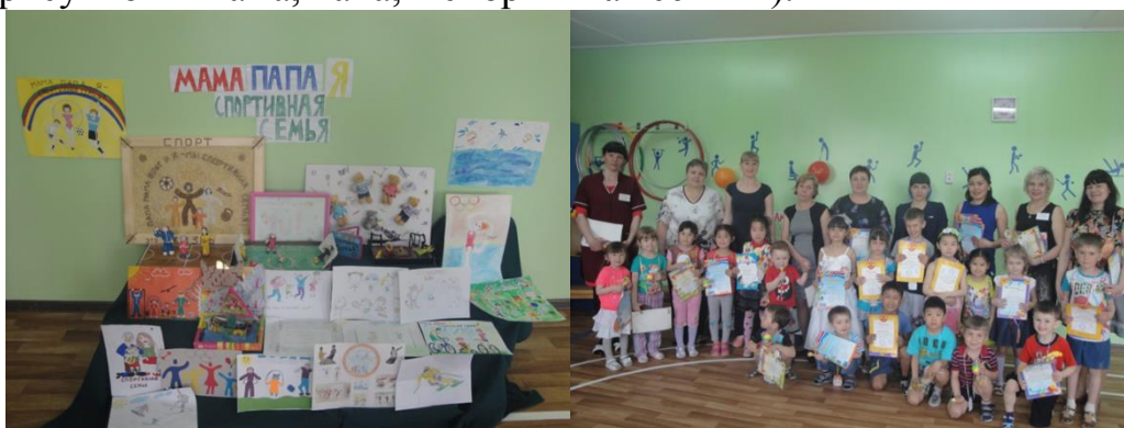
Конкурс «Тренажёр своими руками»

Для реализации этой цели в 2015 году в детском саду был открыт детско – родительский спортивный клуб «Здоровая Семья», в котором мы активно сотрудничаем с родителями, проводим творческие конкурсы (конкурс рисунков «Мама, папа, я спортивная семья»).