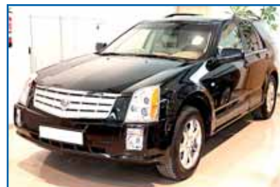
CADILLAC SRX 3500 V6 Año 2006. Full equip.