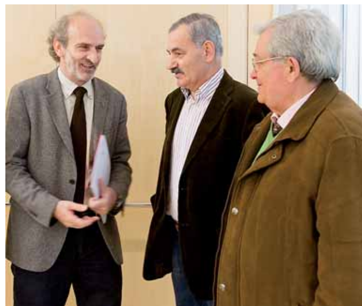
Responsables del Museo de Altamira y del CENIEH rubricaron el acuerdo.

de los objetivos de esta colaboración reside en poder conocer cuál fue la entrada natural de la cueva, cuestión para la que se están controlando algunos desplomes. Fruto de esa colaboración ha sido la aparición de un omóplato de ciervo grabado de hace unos 15.000 años, fecha anterior al momento en el que los habitantes de la gruta pintaron los famosos bisontes policromados, emblema del yacimiento.