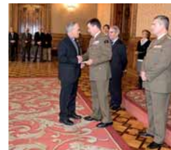
Acto de entrega de los donativos recaudados con el nacimiento.