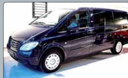
Mercedes Vito Combi L Año 2008. 2 airbags. ESP. ABS. Climatizador. Cristales tintados. RadioCD. 9 plazas. Paragolpes y molduras del mismo tono que la carrocería. 4 elevalunas. Cierre centralizado. 2 años de garantía.