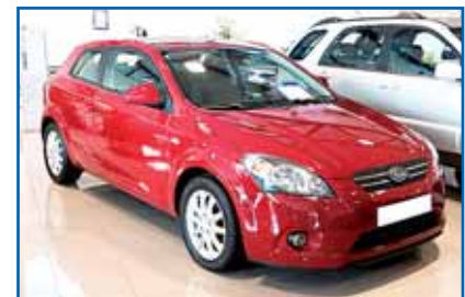
KIA PRO CEED 1.6 CRDI 116 cv. Año 2008. CC. DA. EE. ABS. ESP. Clima Ll. Antinieblas. Control veloc.