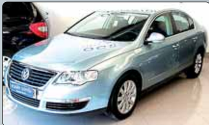
Volkswagen Passat 2.0 TDI Año 2006. 140 cv. 10 airbags. Navegador. Cargador CD's. Climatizador bizona. Elevalunas. Llantas aleación. Pintura metalizada. Espejos eléctricos y calefactados.