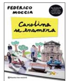
CAROLINA SE ENAMORA Federico Moccia. Novela.