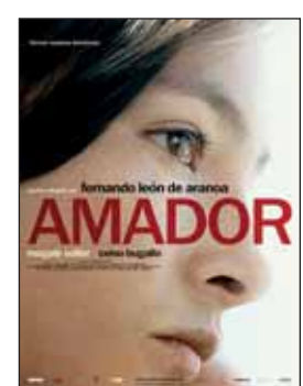
AMADOR Dir. Fernando León de Aranoa. Int. Magaly Solier, Celso Bugallo. Drama.