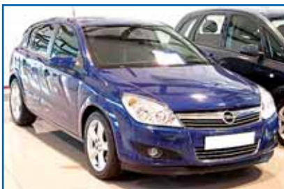
OPEL ASTRA 1.7 CDTI COSMO 105 cv. Año 2007. CC. DA. EE. ABS. Airb. Clima. Ll. Sensor luces y lluvia. Cuero.