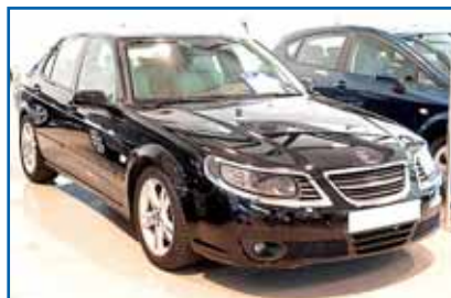
SAAB 9.5 AERO 2.3T 250 cv. Año 2007. Full equip más cuero y navegador.