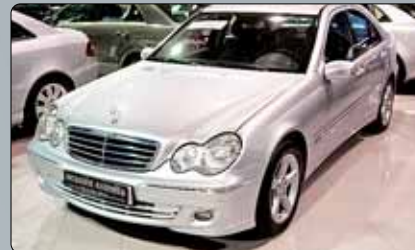
Mercedes Clase C 220 CDI Avangarde Año 2006. 8 airbags. Cambio automático. Navegador. Tapicería mixta tela-cuero. Climatizador bizona. Tempomat. Espejos abatibles. Elevalunas.