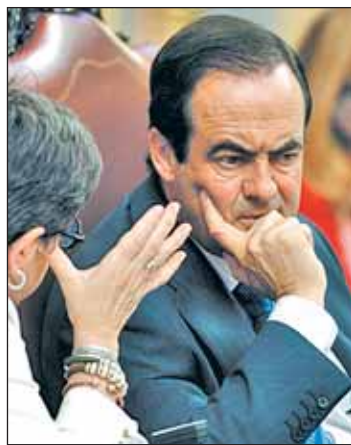
José Bono en el Congreso

Esta semana, José Bono, presidente del Congreso, ha remitido una carta a todos los parlamentarios en la que les emplaza a brindar dentro de una semana propuestas para el futuro del complemento de pensiones, que ha saltado al debate público tras ser calificado como "privilegio" por parte de Rajoy, pese a que tan solo 81 de los 3.600 diputados electos en Democracia se haya beneficiado de él. En su misiva, Bono incide además en otras cuestio-