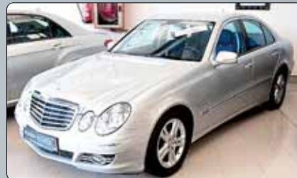
Mercedes E 220 CDI Avangarde 170 cv. Año 2006. 8 airbags. ABS. ES. Climatizador bizona. RadioCD. Cargador CD's. Cierre centralizado. Elevalunas. Faros bixenon. Preinstalación de teléfono. 2 años de garantía.