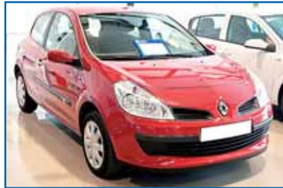
RENAULT CLIO 1.2 3P. Año 2008. 21.000 km. CC. DA. EE. ABS. AIRB. AA. Control veloc.