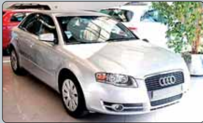
Audi A4 2.0 TDI Año 2007. 8 airbags. ABS. ESP. Climatizador. Dirección asistida. Cierre. Elevalunas. ESP. Volante multifuncional.