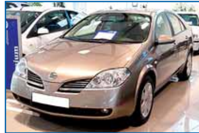
NISSAN PRIMERA 1.6 16V Año 2006. 30.000 km. CC. DA. EE. ABS. AIRB. Clima. Ordenador viaje.