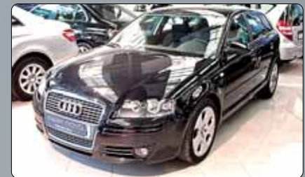
Audi A3 2.0 TDI Año 2006. 140 cv. 10 airbags. ABS. ESP. Climatizador bizona. Cierre centralizado. Llanta 17". Asientos deportivos. Pintura metalizada. RadioCD con mandos al volante. Libro de revisiones. 1 año de garantía.