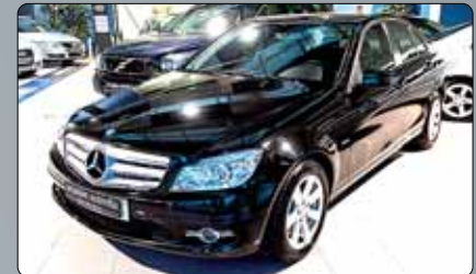
Mercedes C 220 CDI Año 2009. 10 airbags. ABS. ESP. Climatizador bizona. Navegador. Salida USB. Partronic. Cierre centralizado. Llantas de aleación. Pintura metalizada. RadioCD. Manos libres. 2 años de garantía.