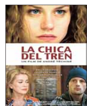
LA CHICA DEL TREN Dir. André Téchiné. Int. Emilie Dequenne, Catherine Deneuve. Drama.