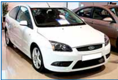
FORD FOCUS 1.8 TDCI SPORT Año 2006. CC. DA. EE. ABS. AIRB. Clima. Ll. Antiniebla.