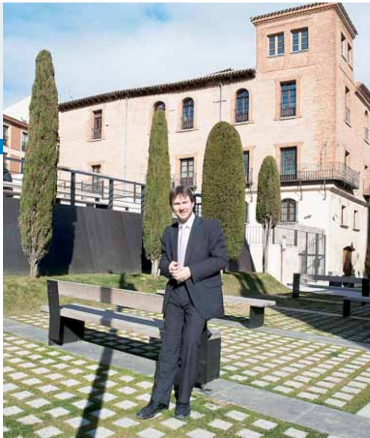
El candidato del PP a la Alcaldía de Burgos, en su rincón favorito de la ciudad, el entorno del Palacio de Castilfalé, remodelado en la actual legislatura.

“ Mi tarjeta de presentación para las próximas elecciones es la labor realizada durante estos años”