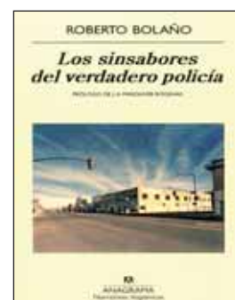
LOS SINSABORES DEL VERDADERO POLICIA Roberto Bolaño. Novela.