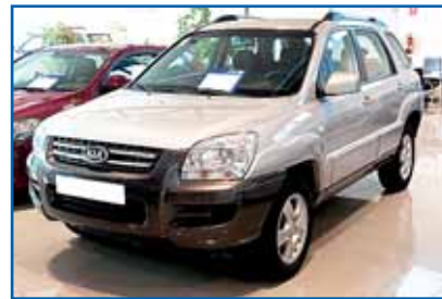
KIA SPORTAGE 2.0 16V Año 2006. CC. DA. EE. ABS. AIRB. Clima.