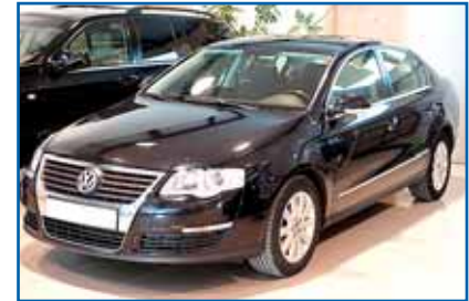
VOLSKWAGEN PASSAT 2.0 TDI 140 cv. Año 2006. CC. DA. EE. ABS. AIRB. Clima. Ll. Control veloc. 6 veloc.