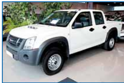
ISUZU D-MAX 2.5 TD 136 cv. Año 2009. CC. DA. EE. ABS. AIRB. AA. Bluetooth. Trac. 4x4 reductora. 20.000 km.