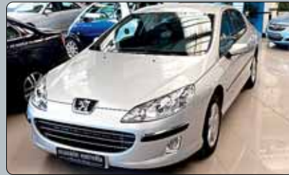
Peugeot 407 HDI 136 cv. Año 2007. 10 airbags. ABS. ESP. RadioCD con Mp3. Llantas de aleación. Control de velocidad de cruceo. Pintura metalizada. Climatizador. Espejos eléctricos y calefactados.