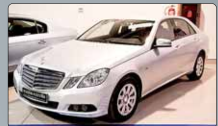
Mercedes Benz Clase E 250 CDI Año 2009. 10 airbags. ABS. ESP. Bass. Pre-safe. Asientos calefactados. Partronick con ayuda al aparcamiento. Cargador de CD's con MP3 y salida auxiliar. Climatizador bizona. Sensor de lluvia y de luz. Tempomat. 2 años de garantía.