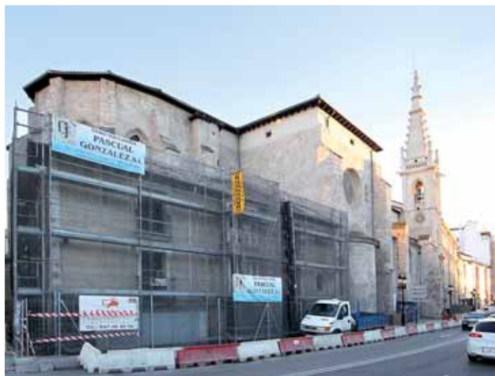
La demolición de la Casa del Botero terminará en unas tres semanas.

Los trabajos del Plan Catedral XXI, las calles Santander y Concordia y la Casa del Botero centran las actuaciones