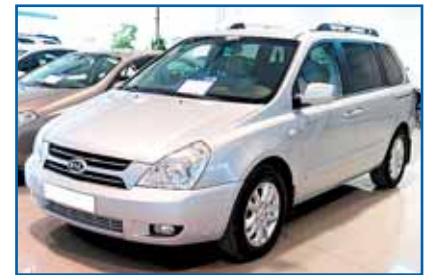
KIA CARNIVAL 2.9 CRDI 185 cv. Año 2009. 14.000 km. CC. DA. EE. ABS. AIRB. CLIMA. Ll. Control veloc. 7 plazas.