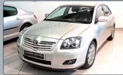
Toyota Avensis 2.0 D 4 D 125 cv. 8 airbags. ABS. ESP. Climatizador. Sensor de lluvia y de luz. Cierre centralizado. Llantas de aleación. Pintura metalizada. Control de velocidad. 3 años de garantía.