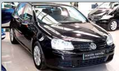
Volkswagen Golf 2.0 TDI Año 2005. 140 cv. Dirección. Cierre. Elevalunas. ABS. ESP. Clima Dual. 1 año de garantía.