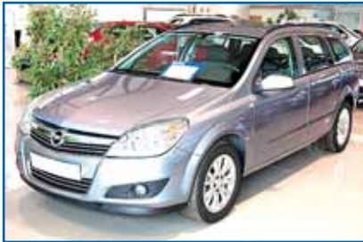
OPEL ASTRA 1.6 16V CARAVAN Año 2008. CC. DA. EE. ABS. AIRB. Clima. Ll. Control veloc.

Grupo Julián Auto tiene coches perfectos para ti, perfectos para todos