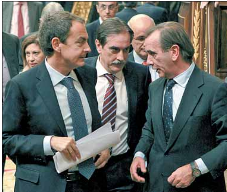
Zapatero, Alonso y Valeriano Gómez, ministro de Trabajo

Los sindicatos y el Gobierno han alcanzado este pacto tan sólo un día antes de que el Consejo de Gobierno del viernes 28 de enero apruebe el anteproyecto de Ley de la reforma sobre el sistema vigente. Los cambios aplicados incluyen además el alargamiento de la edad legal de jubilación a los 67 años, con 37 de cotización para percibir