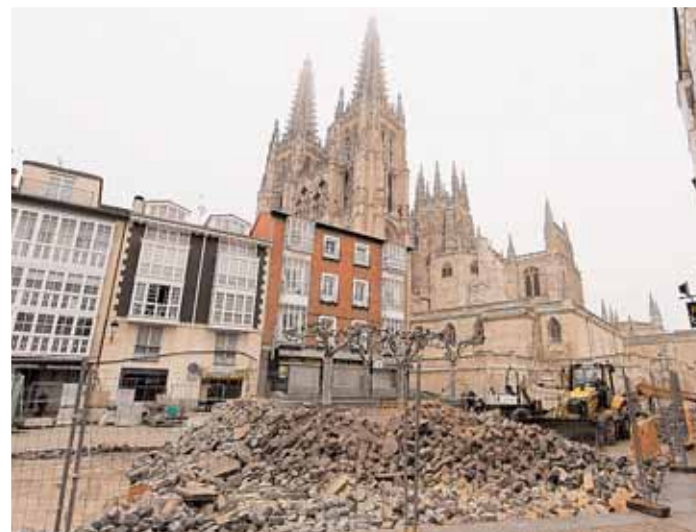
En la calle Nuño Rasura se realizan labores de pavimentación.

Avenida del Cid. Ya se está pavimentando los soportales del número 3, para finalizar las obras en las próximas semanas con la instalación de todo el mobiliario urbano.