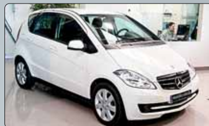
Mercedes Benz Clase A 180 CDI Año 2010. Km. 0. Dirección. Cierre. Elevalunas. ABS. ESP. Partronik. Sensor de lluvia y luz. Clima. 2 años de garantía.