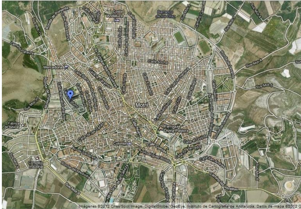
Imagen de Google Maps, destacado con el globo azul la situación del centro

El I.E.S. José Martín Recuerda está situado en la ciudad de Motril (Granada), en el corazón de uno de sus barrios más populares, "Las Angustias". Nuestro alumnado procede tanto del barrio, como del centro de la ciudad y de la localidad vecina de Vélez de Benaudalla, siendo representativo de la diversidad cultural