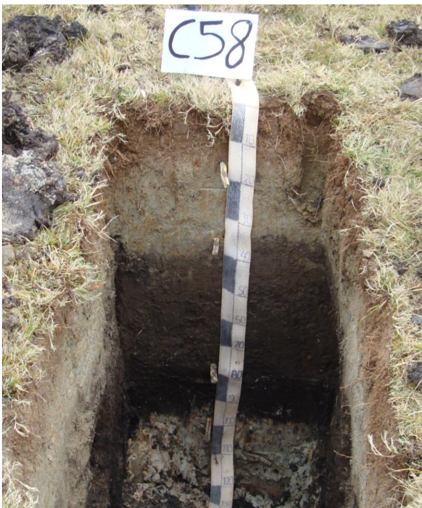
Figura 1. Perfil correspondiente al suelo Azada, son suelos estratificados profundos de textura moderadamente gruesa a fina con problemas de drenaje natural

Su limitación principal está relacionada con el factor clima y se le asigna una aptitud de uso para cultivos en limpios.