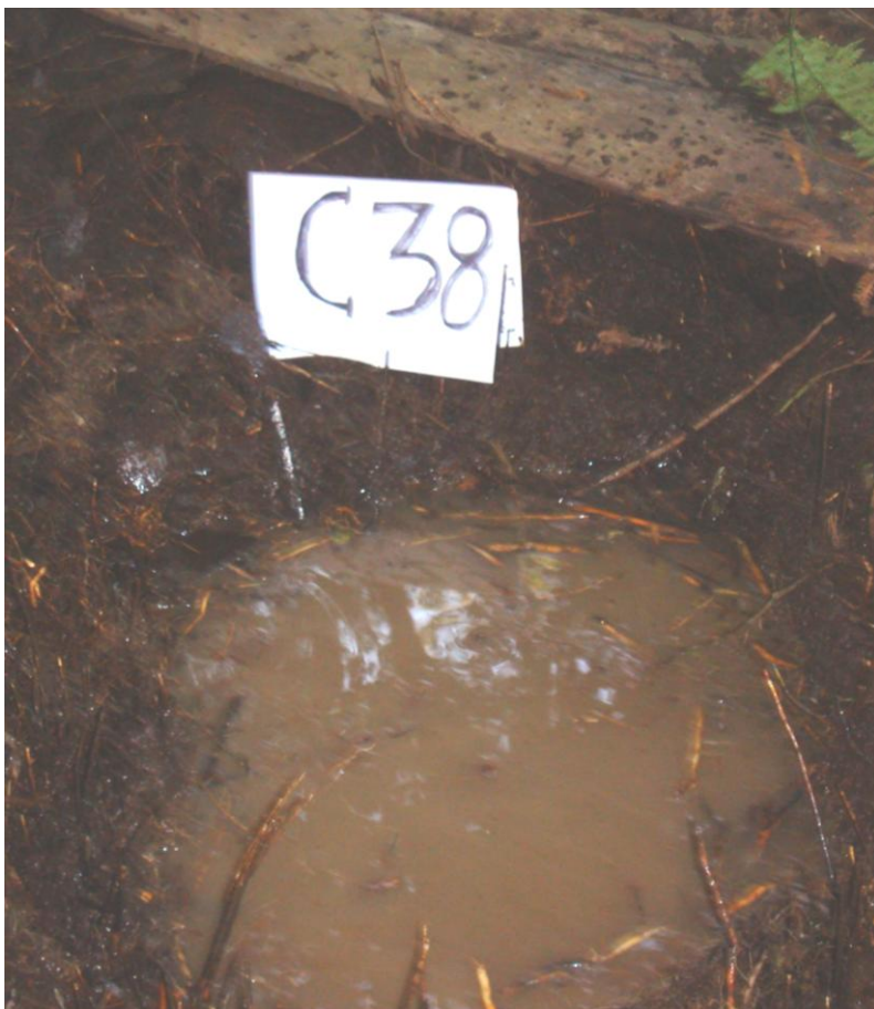
Foto N° 2 Observese la saturación de agua muy superficial en esta calicata

Su limitación principal está relacionada con el factor suelo y drenaje (poca profundidad y baja fertilidad) y se le asignan una aptitud de uso para protección por suelo y drenaje.