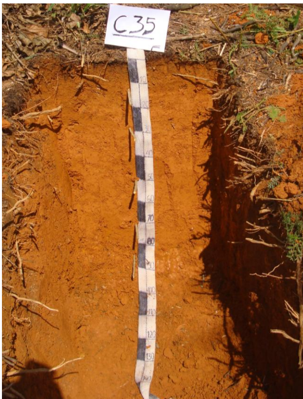
Foto N° 4 Perfil correspondiente al suelo Campo Verde profundos, muy desarrollados y de buen drenaje

Químicamente los suelos son de reacción extremada a muy fuertemente ácida (pH 4,09-4,58) y la capa superficial manifiesta proporciones medias y bajas de materia orgánica y bajas de fósforo y potasio, la capacidad de intercambio catiónico por acetato de amonio varía de 8,64 a 11,84 meq/100g de suelos y la saturación de bases generalmente fluctúa de 12 a 22%.