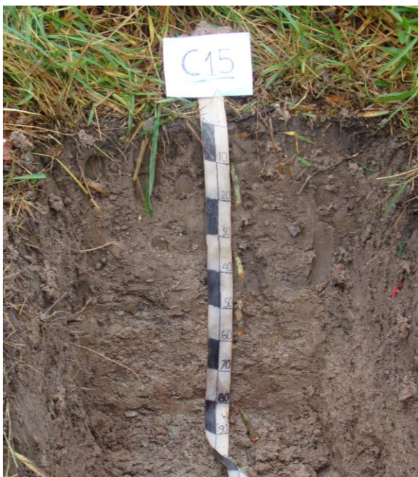
Foto N° 12 Perfil correspondiente al suelo Santa Juliana con desarrollo genético y de textura fina con drenaje bueno a moderado, obsérvese los cotoso rodados de hasta 15 cm. De largo

La descripción de este suelo ya se realizó anteriormente. En el suelo n° 30