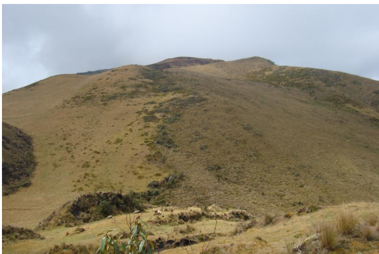
Foto N° 14 Típica vegetación de pajonal alto andino que se desarrolla sobre los suelos de la serie Wincomayo