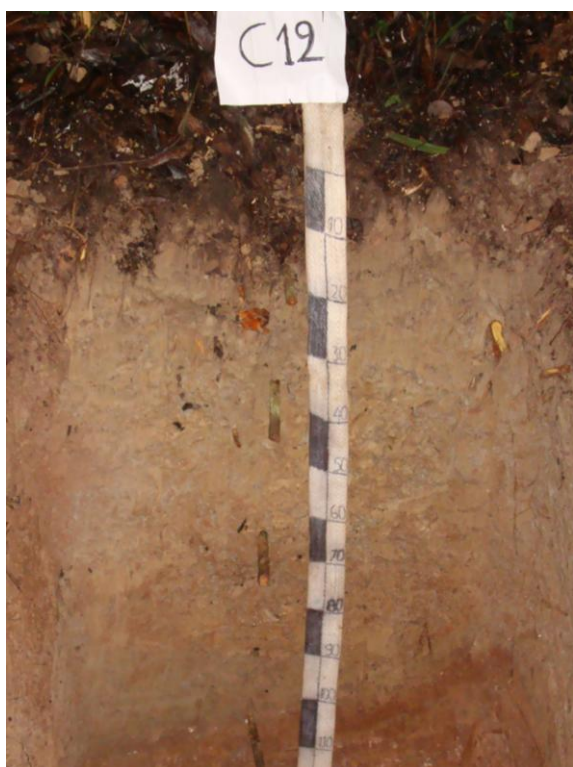
Foto N° 10 Perfil correspondiente al suelo Carretera con desarrollo genético y de textura fina con drenaje bueno a moderado

Químicamente los suelos son de reacción extremadamente ácida a ligeramente ácida (pH 3,8-6,2). La capa superficial manifiesta proporciones medios de materia orgánica, bajos en fósforo y contenido medio de potasio, la capacidad de intercambio catiónico por acetato de amonio varía de 32,32 a 39,52 meq/100 g de suelos y la saturación de bases fluctúa de 80 a 93%.