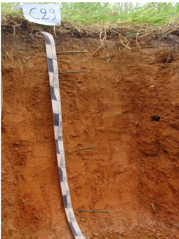
Foto N° 3. Perfil correspondiente al suelo Nueva Honoria, son suelos profundos de textura media, con buen drenaje natural

Su limitación principal está relacionada con el factor suelo, le asignan una aptitud de uso: para cultivo permanente.