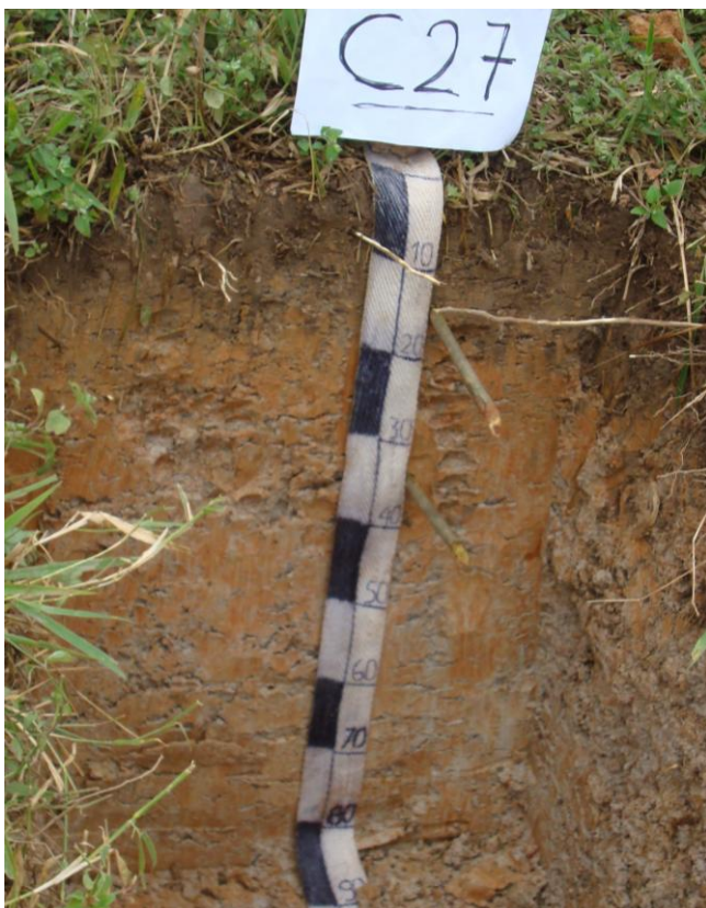
Foto N° 6 Perfil modal correspondiente al suelo Macuya con desarrollo genético y de textura fina con drenaje imperfecto a bueno.