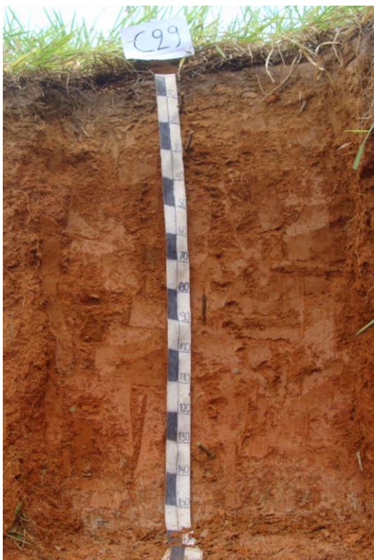
Foto N° 9 Perfil correspondiente al suelo Nuevo porvenir con desarrollo genético y de textura fina con drenaje bueno a moderado.