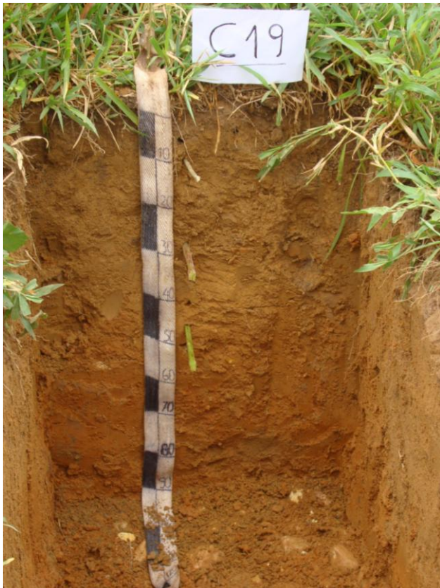
Foto N° 13 Perfil correspondiente al suelo Cantos rodados con desarrollo genético y de textura fina con drenaje bueno a moderado, obsérvese los cantos rodados en la parte inferior de la calicata

Químicamente los suelos son de reacción extremadamente ácido (pH 4,32-4,43) que contiene una proporción baja de materia orgánica, fósforo y potasio disponible, la capacidad de intercambio catiónico por acetato de amonio varía de 6,08 a 12,80 meq/100 g de suelos y la saturación de bases fluctúa de 10 a 32%.