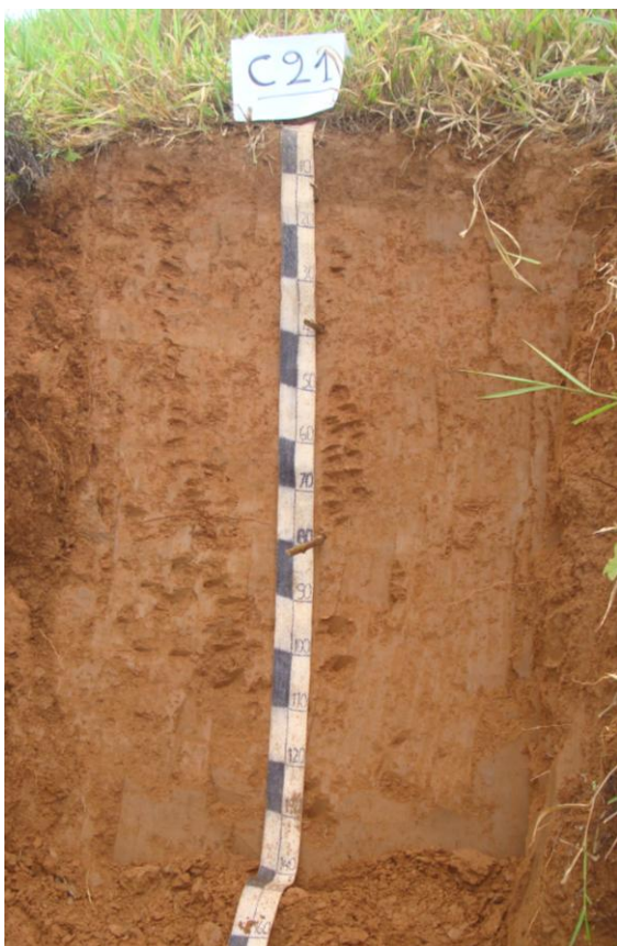
Foto N° 5 Perfil correspondiente al suelo Monterrico con desarrollo genético, profundo de textura franca y drenaje bueno