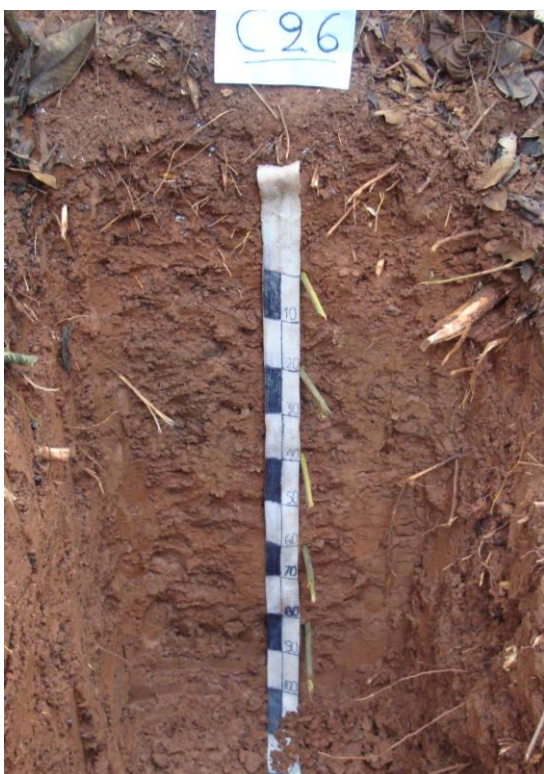
Foto N° 8 Perfil correspondiente al suelo Santa Rosa de Pata con desarrollo genético y de textura fina con drenaje algo excesivo

Químicamente los suelos son de reacción ligeramente alcalina a moderadamente alcalino (pH 7,40-7,90). Los horizontes inferiores poseen alto porcentaje de carbonatos de calcio. La capa superficial manifiesta proporciones bajos de materia orgánica (0,48%), que disminuye abruptamente con la profundidad. El fósforo revela una concentración baja igual que el potasio, la capacidad de intercambio catiónico por acetato de amonio varía de 26,56 a 31,20 meq/100 g de suelos y la saturación de bases es 100%