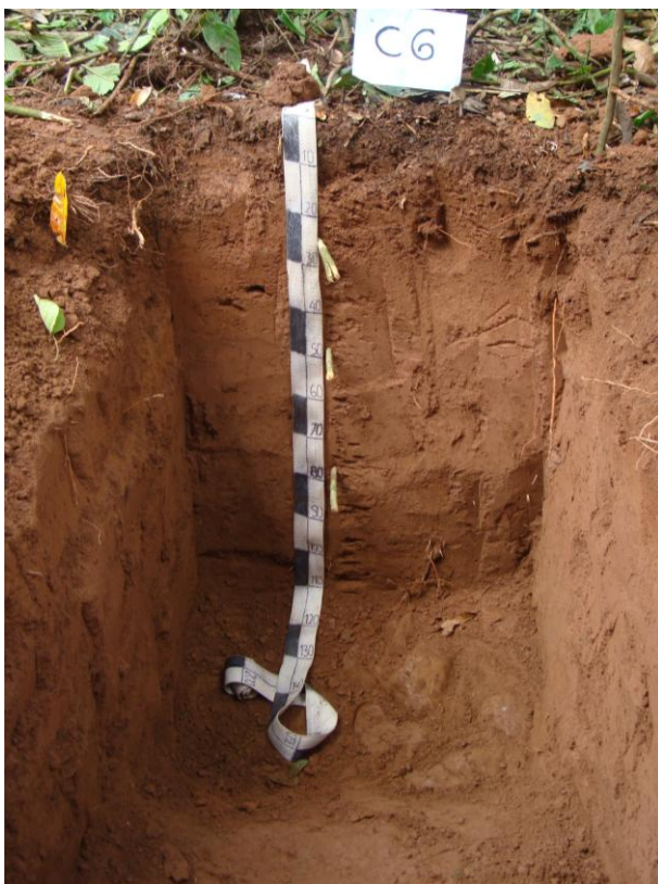
Foto N° 11 Perfil correspondiente al suelo Terraza con desarrollo genético y de textura fina con drenaje bueno a moderado, obsérvese los cantos rodados de hasta 15 cm. De largo

Químicamente los suelos son de reacción fuertemente ácida a fuertemente ácido (pH 4,87-5,48). La capa superficial manifiesta proporciones medios de materia orgánica y fósforo, bajo de potasio, la capacidad de intercambio catiónico por acetato de amonio varía de 4,80 a 14,40 meq/100 g de suelos y la saturación fluctúa de 45 a 88%.