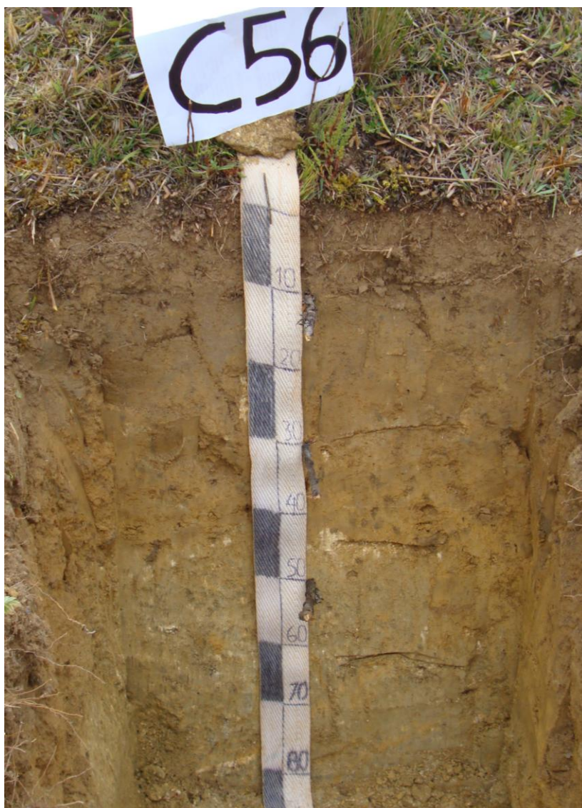
Foto N° 7 Perfil modal correspondiente al suelo Wincomayo con desarrollo genético y de textura fina con drenaje bueno a excesivo