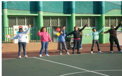
יום ספורט בנושא הזהירות בדרכים בבי"ס רמות בחיפה.

■ תלמידי ביה"ס מקדם הבריאות מכינים ספר על "תרופות סבתא" – ביה"ס היסודי רמות בחיפה פועל כבי"ס מקדם בריאות. הנושא משולב באורח החיים הבית ספרי במגוון רחב של פעילויות. כך, למשל, מתקיימים בביה"ס שיעורי חינוך לבריאות קבועים במערכת השעות, שבהם מודגשים הנושאים; תזונה נכונה, יציבה נכונה ועידוד הפעילות הגופנית. כחלק מתוכנית הבריאות הבית הספרית, מתקיימת אחת לשבוע פעילות ספורט בשם "כושר על הבוקר", הפותחת את יום הלימודים.