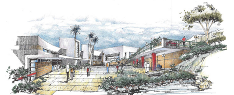
שרטוט הדמייה של הפנימייה למצוינות שתוקם בחיפה. (שרטוט; טולדנו אבי אדריכלים בע"מ)

■ פנימייה למצוינות – בחיפה תוקם בקרוב פנימייה למצוינות. הפנימייה תפעל במתכונת דומה לפנימיות המצוינות בירושלים, שבהן מתחנכים מזה עשרות שנים תלמידים מצטיינים מהפריפריה ומשכבות חלשות. הפנימייה תוקם בשכונת אלמוגי, סמוך לסניף בית בירם של ביה"ס הריאלי, לאוניברסיטת