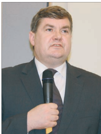
Kazimierz Plocke – sekretarz stanu, Ministerstwo Rolnictwa i Rozwoju Wsi

Rybołówstwo dalekomorskie stanowi drugi, obok rybołówstwa bałtyckiego, element polskiego rybołówstwa. Zdolność połowowa 4 statków wykonujących rybołówstwo dalekomorskie wynosi 21 276 GT i 18 415 kW.