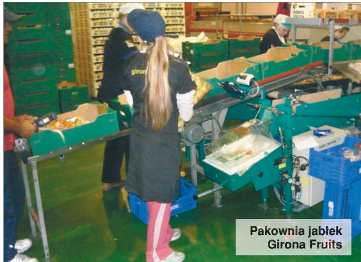
Pakownia jabłek Girona Fruits

Gospodarstwo uzyskało w ciągu roku dopłaty bezpośrednie oraz dotacje unijne w wysokości 90 tys. euro, to jest ok. 1200 zł na 1 ha.