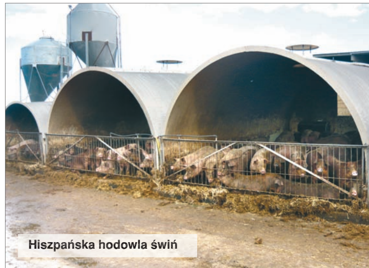
Hiszpańska hodowla świń

Dwumilionowe miasto Barcelona oraz znaczną część Hiszpanii zaopatruje potężny rynek hurtowy „Mercabarma” zlokalizowany na 90 hektarach blisko centrum miasta, w którym działa 800 firm, a pracuje w nim około 25 tys. osób. Rynek hurtowy jest spółką, w której miasto Barcelona ma 51% udziałów, ościenne