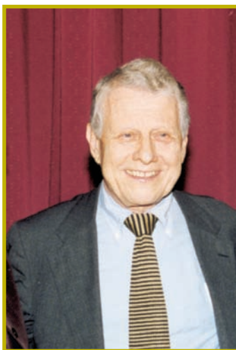
Καθηγητής Charles Tilly