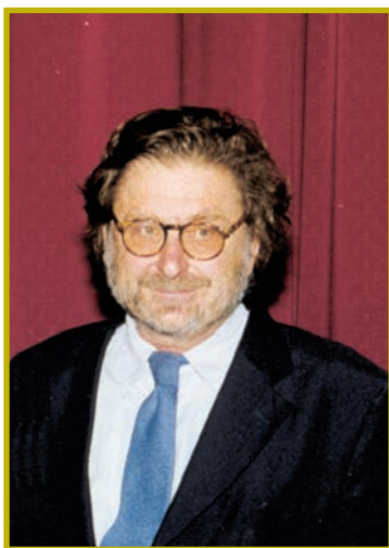
Καθηγητής Νίκος Μουζέλης