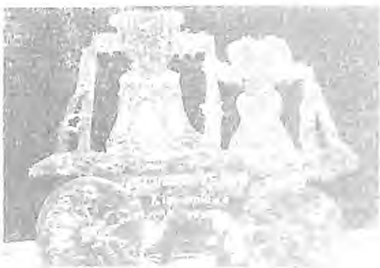
Svěcení zvonů 2. dubna 1923

První světová válka zanechala stopy i ve Světlíku. V roce 1922 byla kaple pod věží přestavěna na pamětní kapli za padlé. Protože během války byly mnohé zvony zabaveny a přetaveny v municí, museli faráři a kooperátoři brzy po skončení války nahradit odevzdané zvony novými. Na velikonoční pondělí 2. dubna 1923 byly opatem Gilbertem Schartnerem vysvěceny nové zvony, vzápětí vyzdvíženy a kolem 14. hodiny již poprvé zvonily.