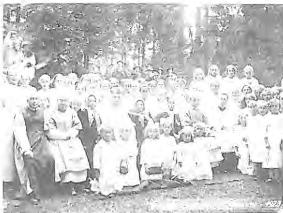
Svěcení zvonů – Trojany