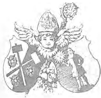
Erb 1. opata kláštera Schlägl Martina Greysinga