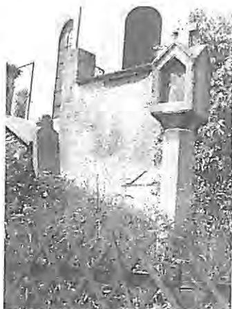
Foto sloupu umístěného dnes u kostela