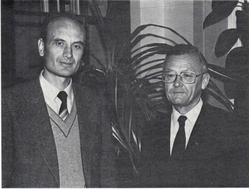
een unieke foto van beide superiors

Volgende tekst ontvingen we enkele dagen na de bekendmaking van de benoeming van beide superiors uit de handen van een poësis-leerling.