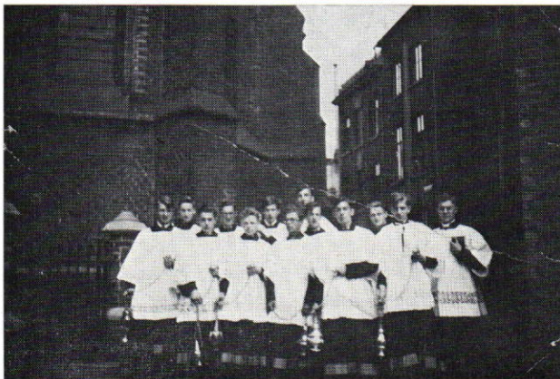
De groep der „wierookzwaaiers”.

Eerst werden we, zoveel mogelijk volgens grootte, in groepjes van twee ingedeeld en dan in twee rijen van zes achter elkaar opgesteld. De ene rij marcheerde, neen, schreed aan de linkerkant van een ingebeelde straat, de andere rij aan de rechterkant. — Marcheren immers doet te militaristisch aan, dat deden wij op K.S.A.-kampen achter Chirovaandels, maar aangezien het hier om een devote handeling gaat, klinkt „schrijden” dan ook veel devoter. —