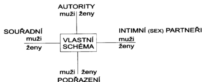
Obrázek 1. Skupinové schéma.

nové dění nepřetržitým pozadím duševního života v bdění i ve snu. Skupinové schéma je složeno z různých rolí (mužské, ženské, osob nadřazených, podřazených, souhradných, erotických a sexuálních partnerů). Vztahová vazba (attachment) je součástí skupinového schématu jako vztah mezi dvěma osobami, jako dvě role. Různé role mají různě silný etologický program. Tento program je nejsilnější ve vztahové vazbě (Bowlby, 1969) vztahu dítěte k osobě s mateřskou funkcí, což někdy nemusí být matka. Skupinové schéma (obr. 1) má tři funkce: 1. je kognitivní mapou, jež pomáhá interpretovat sociální situace, 2. je tréninkovým hřištěm sociálních vztahů a jejich řešení ve fantazii a 3. je náhradní sociální směnou, jak je například zřejmé v činnosti svědomí, jež odměňuje uspokojením nebo trestá výčitkami. Společně s využitím technik, verbálních a neverbálních (psychodrama, řízená abreakce, atd.) zahajuje náhled a proces korektivní zkušenosti, vedoucí k modifikaci osobnosti.