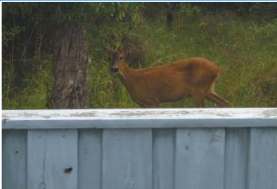
Det træværk trænger vist til noget maling .....