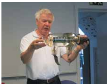
Radorøret fremvises (en anseelig størrelse)