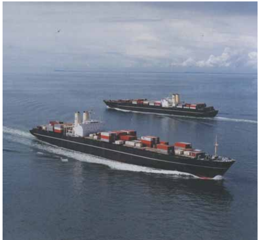
Containerskibene Jutlandia og Selandia leveret fra B&W i 1972