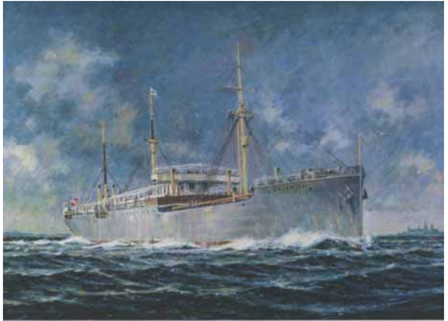
Selandia, maleri af Johannes E Møller

Udsyn – ØK, Danmark og verden. Forlag: Lindhardt og Ringhof Forfatter: Martin Iversen 664 sider. Pris: 499,95 kr. ISBN 978-87-11-397169