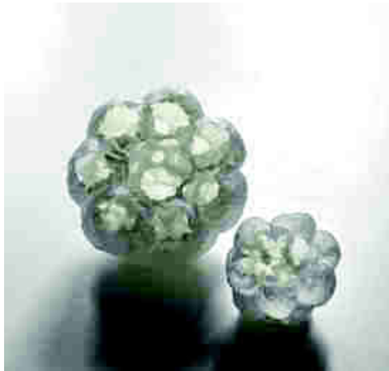
Arriba: Omur Tokgoz. "Nameless". 18 x 12 x 10 cm, 2018. Abajo: Omur Tokgoz. "In-visible cities". 2017. 14 x 10 cm (cada uno).

La porcelana y la translucidez llevada al límite por Omur Tokgoz (Afyon, Turquía, 1966) crean un mundo mágico de piezas de porcelana >