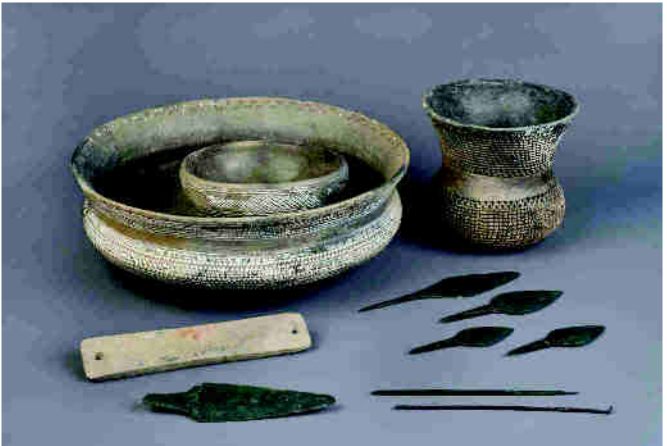
Arriba: Selección de piezas campaniformes procedentes de varios yacimientos madrileños (La Salmedina (Vallecas, Madrid); Humanejos (Parla) o el Juncal (Getafe). Se presenta un lote típico de ajuar de enterramiento campaniforme, con vaso, cuenco y cazuela estilo Ciempozuelos, así como un conjunto de elementos metálicos de cobre característicos de este horizonte: conjunto de puntas de lanza tipo Palmela, puñal "de lengüeta", varillas/punzones, y los conocidos como "brazales de arquero" (de función discutida) fabricados en piedra pulimentada.