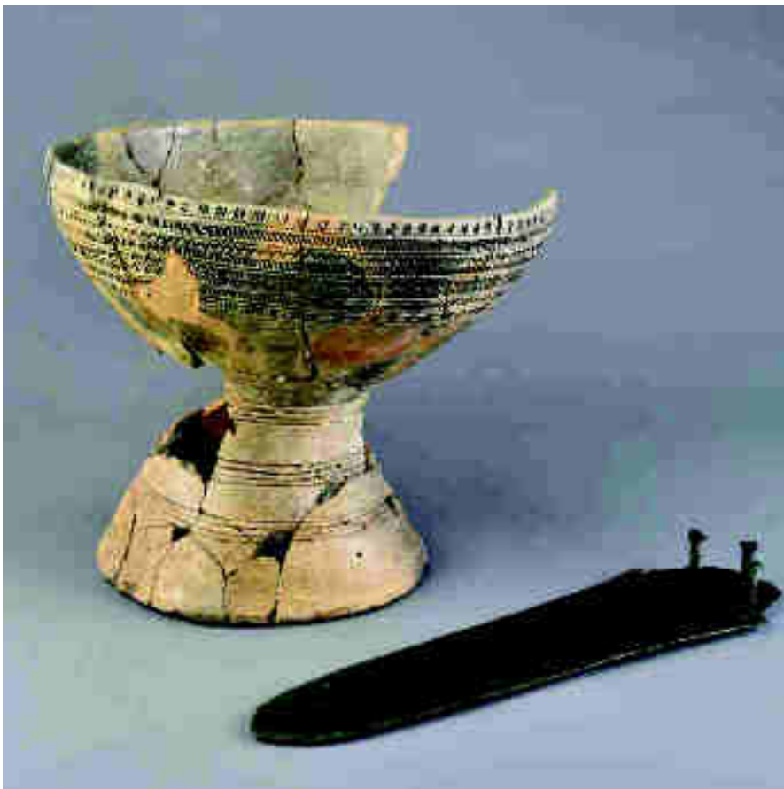
Izquierda: Dos piezas excepcionales a nivel peninsular: Copa ceremonial de estilo Ciempozuelos y alabarda de tipo "Carrapatas", en cobre; ambas proceden del yacimiento Humanejos, en Parla. La presencia de este tipo de elementos en los enterramientos subraya el uso ceremonial y ritual de gran parte de las manifestaciones simbólicas campaniformes, así como la voluntad de expresión de prestigio asociado a los elementos metálicos presentes en las tumbas.