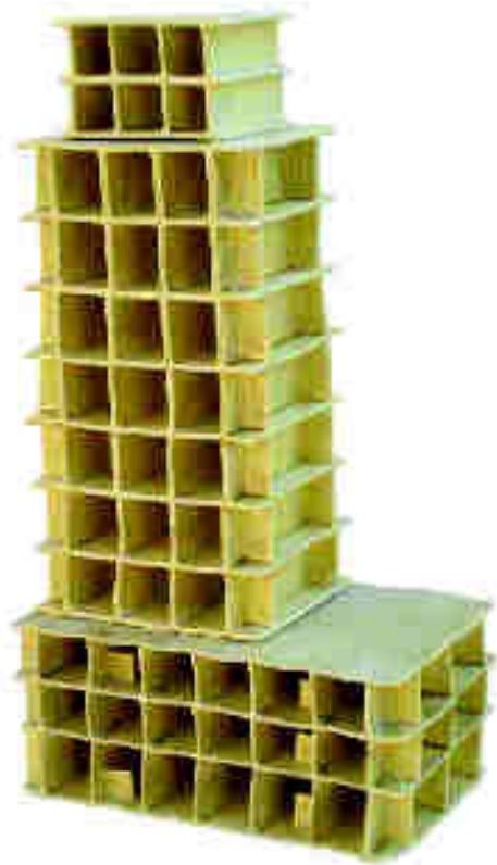
Arriba: José Cuesta. "45 Vidas-2", 2009. Porcelana con papel y esmaltes 1270 °C. 65 x 35 x 22cm. Derecho: José Cuesta. "Vivo en las afueras". Porcelana con papel y esmaltes.

En la otra página. Arriba a la izquierda: María Geszler. "Dangerous Bird." Arriba a la derecha: María Geszler. "Meteorite Hungary." Abajo: María Geszler. "Meteorite Scandinavia."