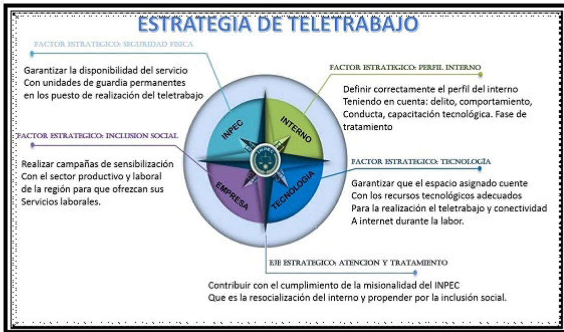
Figura 3. Estrategia de teletrabajo para EP Heliconias.