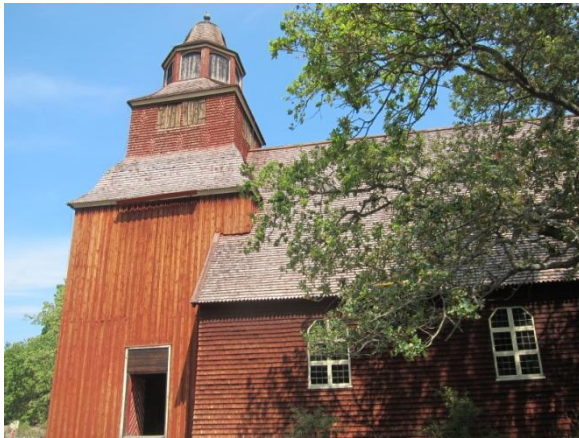
Seglora kyrka på Skansen 2018-07-18

I Kringla kan du söka i flera av Sveriges museers och arkivs samlingar. Här hittar du information om fornlämningar, byggnadsminnen, kyrkor, föremål och fotografier. Fotografierna föreställer kulturhistoriska miljöer från 1860-talet fram till idag och omfattar just nu 2 171 138 fotografier.