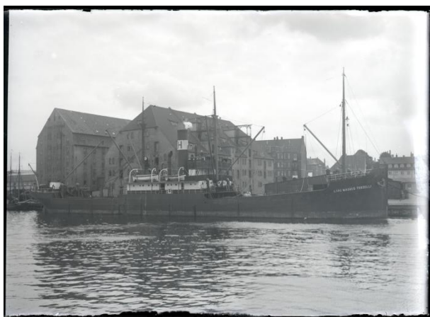
S/S Lars Magnus Trozelli