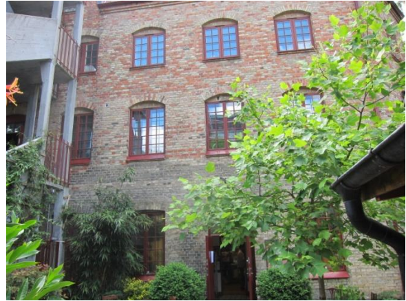
Magasinet, Bredg 28, Lund 1817-06-19