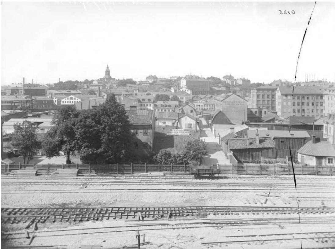
Bryggargatan mot Kungsholmen, Utsikt från Centralbangården 1890 – 1911.

Här hittar du fotografier, konstverk, texter och dokumentation från Stadsmuseet. I Stockholms stadsmuseums fotografiska samlingar finns drygt 3 miljoner bilder: negativ av glas och plast, fotoalbum, diabilder och många andra fotografiska material från 1840-talet fram till idag. Fotografierna digitaliseras och tillgängliggörs på Internet löpande och vid beställning. Den största delen av materialet speglar Stockholm genom tiderna. Det finns bl.a. stora porträttsamlingar, pressbilder och fotografier från förvaltningar i staden.