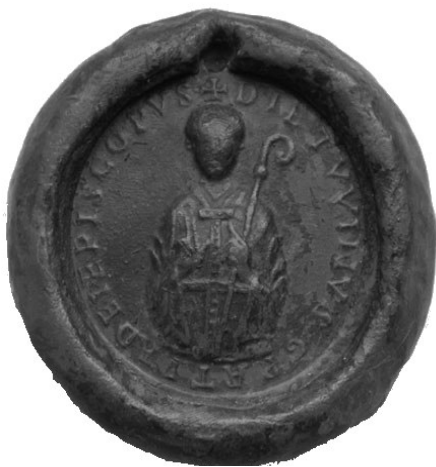
Sceau de l'évêque Théoduin Musée Communal de Huy

Avant les aménagements gothiques de la collégiale, le chroniqueur hutois Maurice de Neufmoustier, qui écrivait vers 1230, a décrit le tombeau de Théoduin : "Autour d'une pierre tombale en marbre noir surgissaient six colonnes de bronze doré supportant une plaque