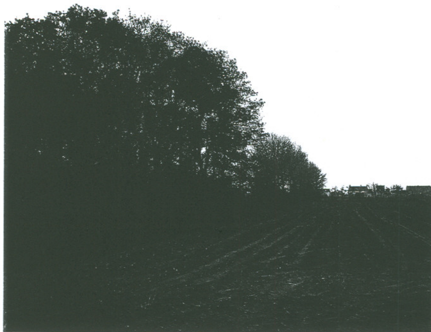
Houtkant tussen akkers

De reeds hoger beschreven grote verscheidenheid aan milieus in dit landschap draagt eveneens bij tot de soortenrijkdom van de avifauna en het zeer hoog aantal broedvogels, waaronder de Boomvalk, Sperwer, Steenuil, Groene Specht, Matkopmees, Wielewaal, Fluiter, Staartmees, Nachtegaal en de zeer zeldzame Draaihals.