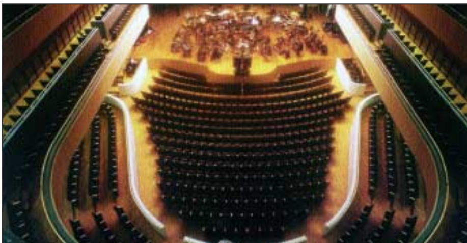
Χρήση LVL σε μέγαρο μουσικής