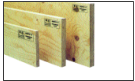
Πίνακας 2. Μονάδες κατασκευών L.V.L και O.S.B. σε όλο το κόσμο

Στην Ιαπωνία, το 51% της παραγωγής L.V.L χρησιμοποιείται για κατασκευές, όπως στέγες, πατώματα, κουφώματα, κ.α., το 7% χρησιμοποιείται σε έπιπλα και το υπόλοιπο 42% σε διάφορες άλλες