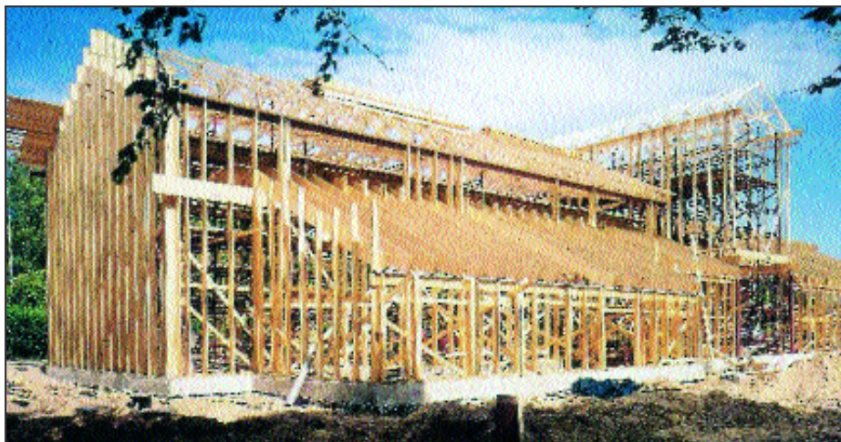
Δημοτικό σχολείο στο Ελσίνκι κατασκευασμένο από LVL

Τα υπολείμματα του υλικού είναι ελάχιστα, γιατί κατά την κατασκευή του L.V.L.