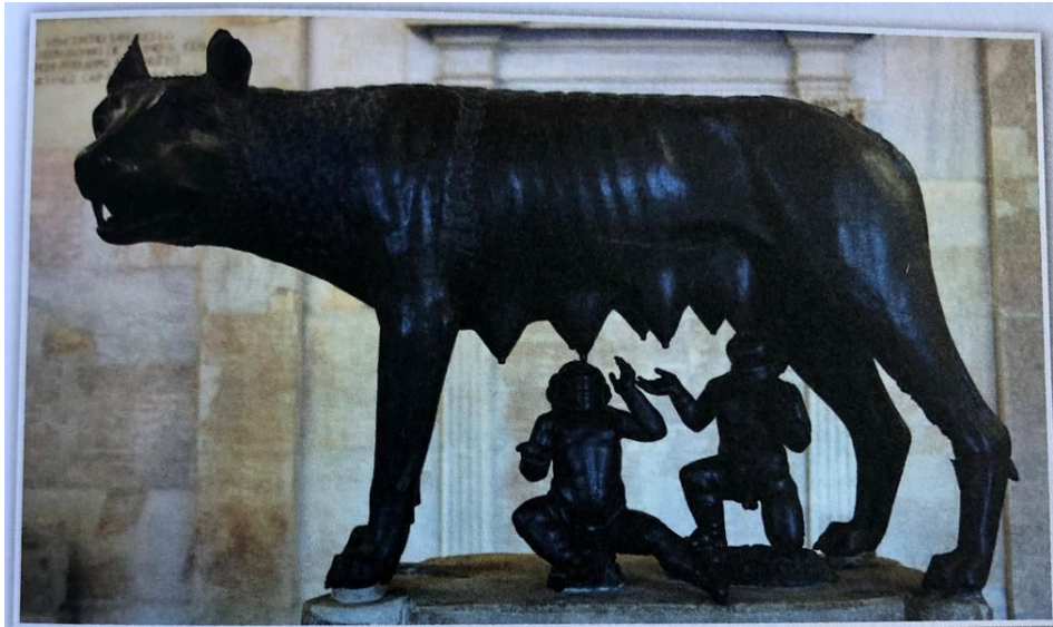
Obr. 1 – Kapitolská vlčice

Symbolem Říma je kapitolská vlčice . Socha byla původně považována za dílo Etrusků, pravděpodobně se však jedná o sochu z pozdější doby. Figurky Romula a Rema byly doplněny až v době renesance.