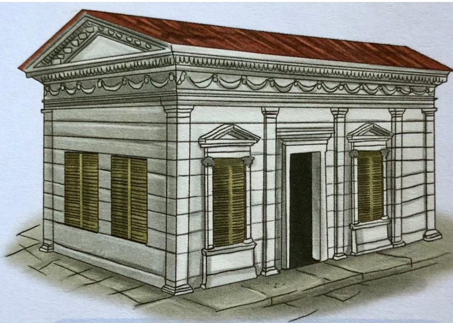
Obr. 4 – Regia . V této budově na Foru Romanu sídlil pontifex maximus (velekněz).