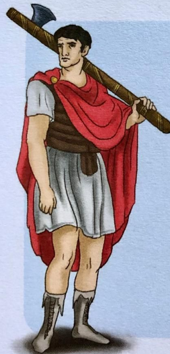
Obr. 6 – Liktor

Odznakem moci úředníka byly svazky prutů ovinuté červenou stuhou, v nichž byla vetknuta sekera. Ta se musela před vstupem do města odložit. Svazky prutů nosili na ramenu liktoři, kteří kráčeli před a za úředníkem. Podle hodnosti úředníka se lišil počet liktorů, kteří ho doprovázeli.