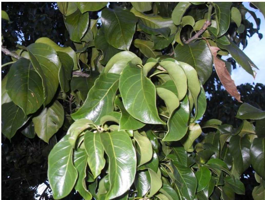
Figura 3 - Folhas Galesia integrifolia (Spreng) Harms.

Essa espécie ocorre nas formações florestais do complexo atlântico, em vários estados brasileiros, desde o Ceará (latitude 04° S) até o Paraná (latitude 25° 30' S). Ocorre preferencialmente em terrenos profundos, úmidos e de alta fertilidade, sendo considerado padrão de terra de boa qualidade. Portanto, esta ampla distribuição geográfica envolvendo ambientes com características de solo e clima muito diferentes é um indicativo de alta variação genética na espécie (SATO et al., 2004).