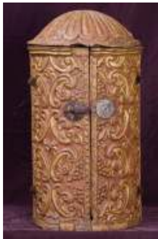
Retablo tubular (móvil o tríptico)

RETABLO TUBULAR. Altar de viaje. Retablo pequeño o mediano, con la forma de tubo, que sirve para