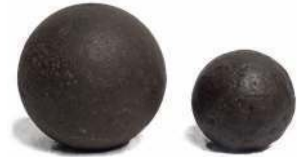
Bolas de cañón

BOLAS DE CAÑÓN. Piezas esféricas, hechas de hierro, utilizadas como proyectiles para los cañones. Su tamaño depende del diámetro del cañón.