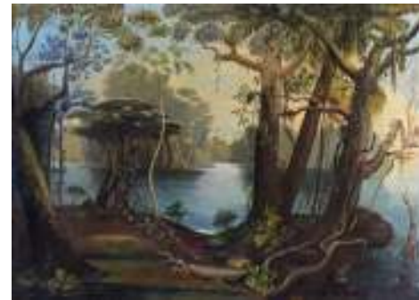
Plein air (naturaleza)

PLUMA. 1. Cada una de los componentes que cubren la piel de las aves. Material queratinoso formada de un elemento central, el cañón y las barbas. Cortada la extremidad del cañón servía antiguamente para