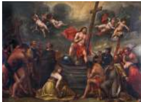
Bíblico (escena bíblica)

BÍBLICO. Escena o tema relacionada con las narraciones de la Biblia, que se representa en la pintura o la escultura.