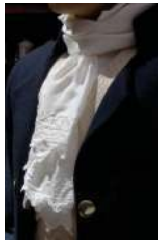
Chorrera de encaje

CHORRERA DE ENCAJE. Especie de corbata masculina, hecha a base de encajes, que caen por el frente a manera de vuelos.