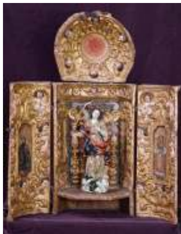
Retablo tubular abierto (móvil o tríptico)

ser transportado con facilidad. El retablo se aprecia cuando se abre la estructura, formando generalmente un tríptico. Eran muy usados desde la época colonial hasta finales del siglo XIX o inicios del XX.