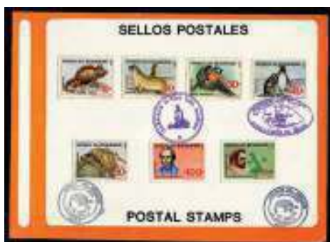
Hoja de recuerdo

HOJA DE RECUERDO. Hoja especial con uno o más timbres, y con inscripciones relativas a algún evento.