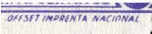
Pie de imprenta

PERFORACIÓN. Procedimiento empleado para facilitar la separación de los sellos de una hoja o tira,