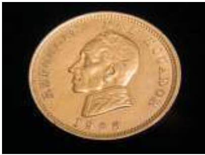
Cóndor (de oro)

Kemmerer. Para su amonedación se retiró de circulación algo más de 60.000 monedas de 10 Sucres (El Ecuatoriano 1899 y 1900) cantidad que sirvió para recañar las nuevas divisas.