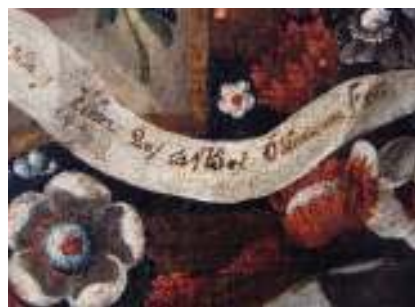
Me Fecit (inscripción del autor)

MEGILP. Tipo de pintura al óleo que consiste en una mezcla de barniz de mastic y aceite de linaza. Produce una pintura delgada, suave y brillante, fácil de trabajar pero que, con el tiempo, se deteriora.