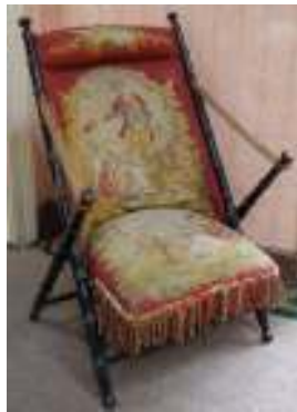
Silla de caderas

llones y sofá con que se amuebla una habitación. 2. Conjunto de asientos situado en el coro de las iglesias.