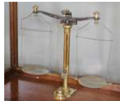
Balanza de precisión

CON SOPORTE Y BRAZO LATERAL. Ajustado a una regleta curva, con un solo platillo.