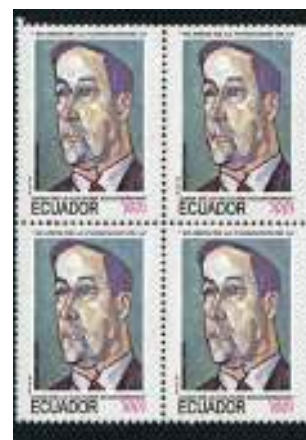
Bloque de cuatro

cionismo extendida que consiste en el conjunto de cuatro sellos iguales que unidos conforman un rectángulo.