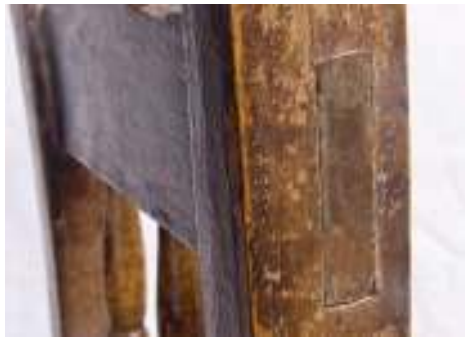
Unión caja y espiga