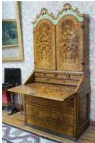
Bufete (siglo XVIII)

BUFETE. 1. Mesa con cajones que se utilizaba para escribir. 2. Especie de escritorio que permanecía arriado a la pared, pudiendo ser desplazado al centro de la estancia cuando era necesario.