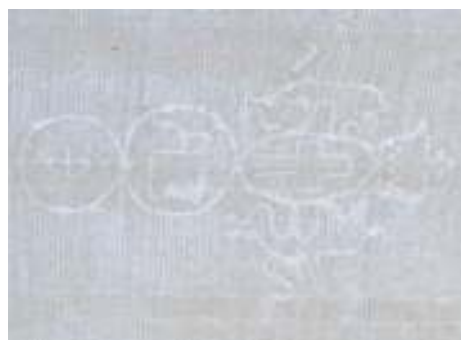
Marca de agua

MARCA DE AGUA. Imagen que llevan algunos papeles como adorno, para mostrar el origen auténtico o para, con ella, evitar las falsificaciones. Las diversas marcas de agua identifican las diferentes fábricas de papel por lo que, a partir de la información que aportan, se puede datar y establecer la procedencia del escrito.