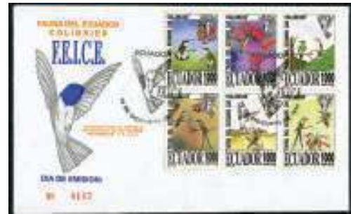
Sobre de Primer Día

SOBRETASA. Valor adicional que se agrega al valor postal, generalmente con fines benéficos o para ayudar a la financiación de algún evento.