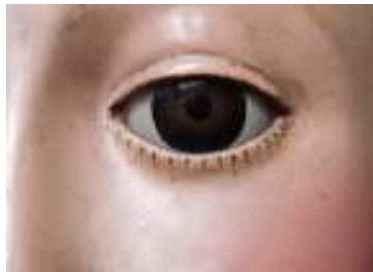
Ojo de vidrio