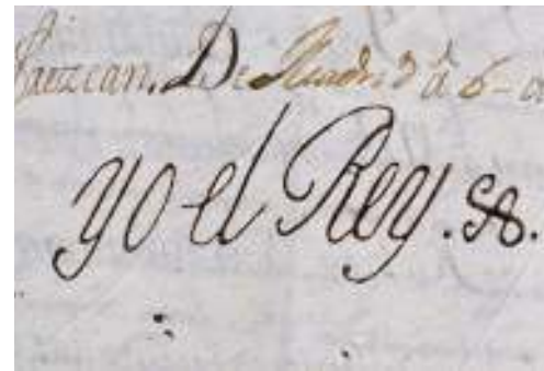
Cédula Real (detalle)

que asisten al Consejo (Consejeros de Indias). Cuando el Rey no actúa solo, “firma n.n. y con el ella el Rey”. La Cédula Real puede ser manuscrita o impresa. Es firmada por el Rey.