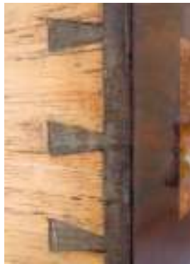
Cola de Milano