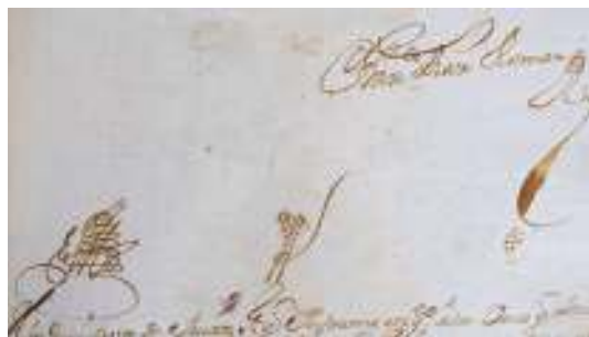
Firma y Rúbrica

FIRMA Y RÚBRICA. Comprende la firma, con el nombre y apellido de la persona, junto con la rúbrica en el documento.