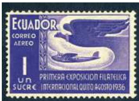
Aerofilatelia (sello aéreo)

AEROFILATELIA. Campo de la Filatelia que se encarga del estudio de los sellos y documentos relacionados con el transporte aéreo de la correspondencia.