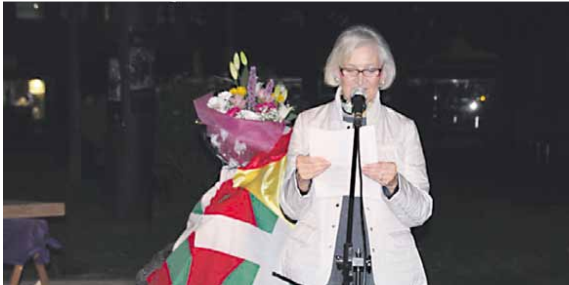
Ahaztu Gabeak ekitaldia antolatzen du, urtero, 1936 Kultur Elkarteak Kurutzian.

Argentinako kereilagaz bat egiteaz gainera, Martxoaren 31ko bonbardaketaren erantzuleak dagozkien auzitegietara eramane gura dituzte