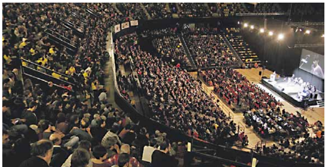
4.150 bertsozaleren aurrean kantatu zuten Bizkaiko Bertsolari Txapelketako zortzi finalistek.