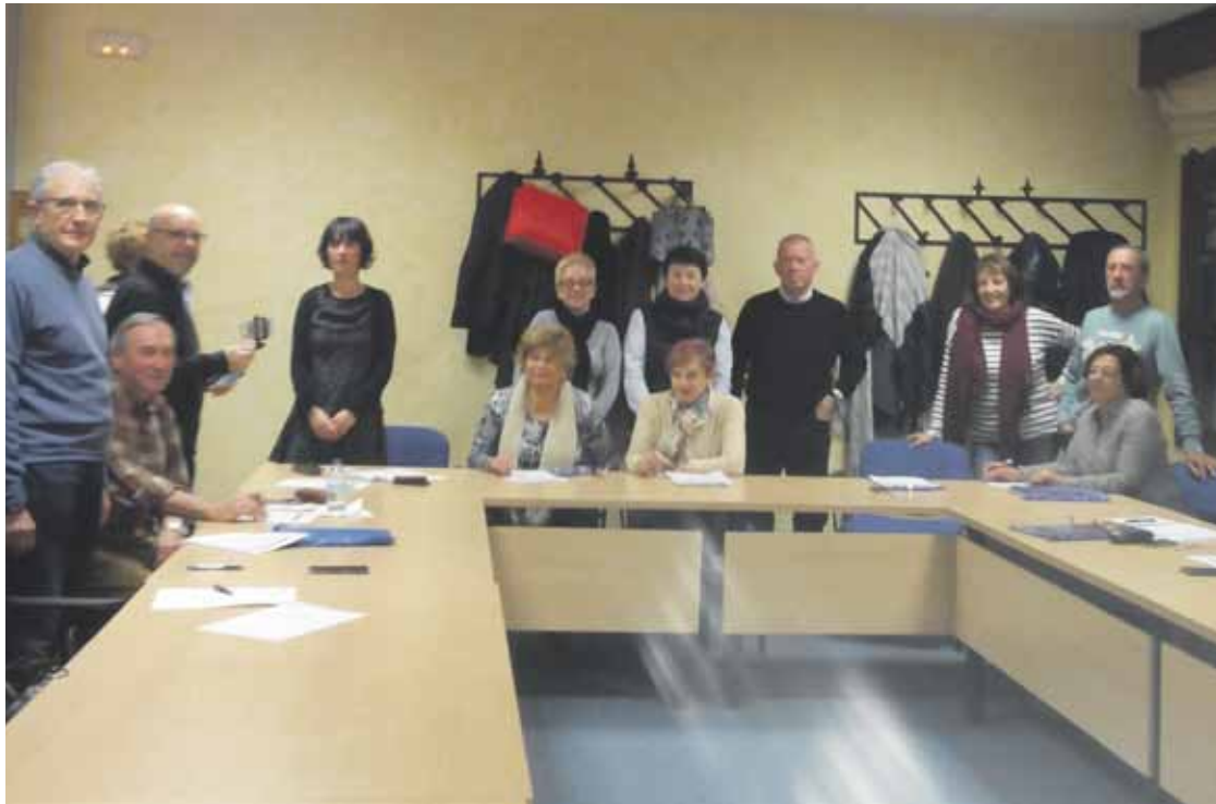
Esperientzia Institutua Behargintzan kokatuta dago.

Ikastaro hau elkarlanean antolatzen dute Durangoko Udalak eta Durangaldeko Amankomunazgoak