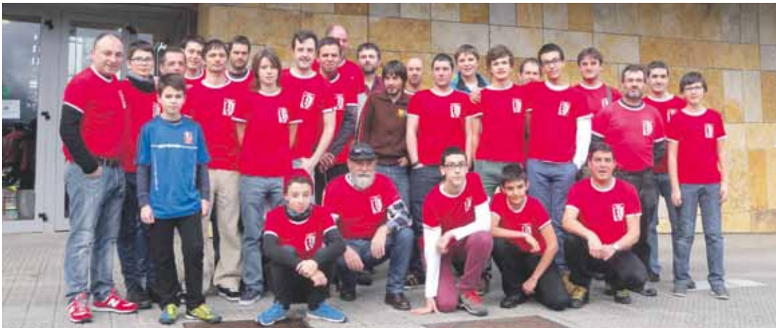
Aurtengo denboraldi hasieran ateratako familia argazkia.

Euskal Ligako Ohorezko Mailan ordezkariak duten Durangaldeko talde bakarra dira gaur egun