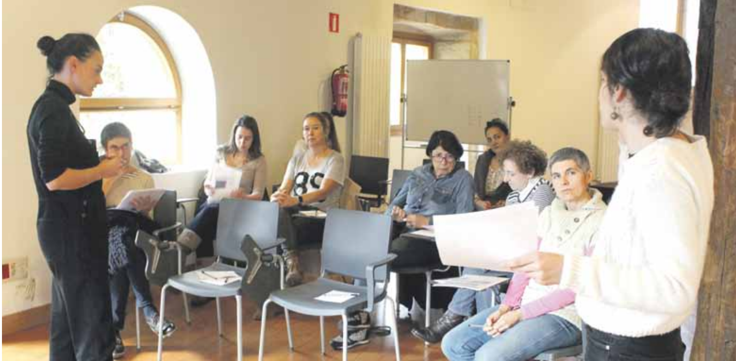
Zapatuan egin zuten prozesu honetako azken tailerra Durangoko Andragunean.

Durangon egindako azken Hiri Debekatuaren maparen arabera, herrian 33 puntu beltz eta gorri daude