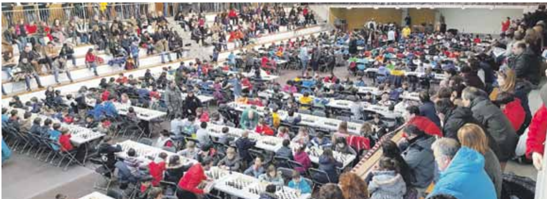
Otsailean 400 gazte batu zituzten Abadiñoako probalekuan antolatutako xake txapelketan.