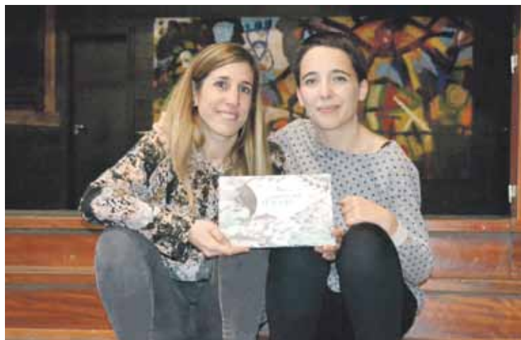
Harrera ona izan zuen ‘Bainera bete itsaso’ albumak Durangoko Azokan.