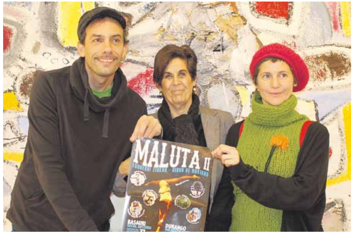
Joan zen astean Durangoko Museoaan egin zuten II. Maluta aurkezteko agerraldia.

Eguberriko zirkuaren hiru emanaldi egin zituzten iaz, eta bete egin zen San Agustin. Aur-