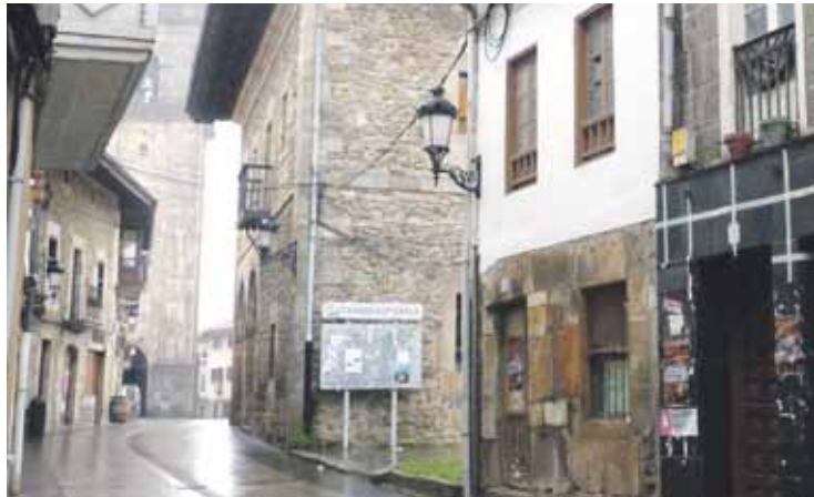
Eskumako aldean Artekaleko 1,3 eta 5. zenbakietako eraikin biak eta orubea.

OTXANDIO Joseba Derteano Andresa Landa fundazioak nagusientzako auzo etxe bat egingo du Otxandion. Urteetan lantzen dabilen asmoa Artekale kalean bere jabetzan duen eraikin batean gauzatuko du. Udalak bere jabetzakoa den beste orube bat du ondoan eta fundazioak proposamen bat egin zien: bi espazio horiek eta hirugarren eraikin bat batuz, gunehori denen artean eraberritzea eta nor bere beharrianetarako erabiltzea. Azken udalbatzarren EH Bilduk (Gobernu Taldea) eta EAJk —udalbatzarra osatzen duten alderdi biek— aho batez onartu zuten proposamena.