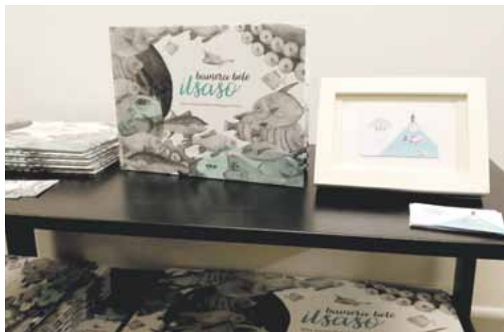
Urtarrilaren amaierara arte egongo da erakusketa ikusgai Arteka liburu-dendan.