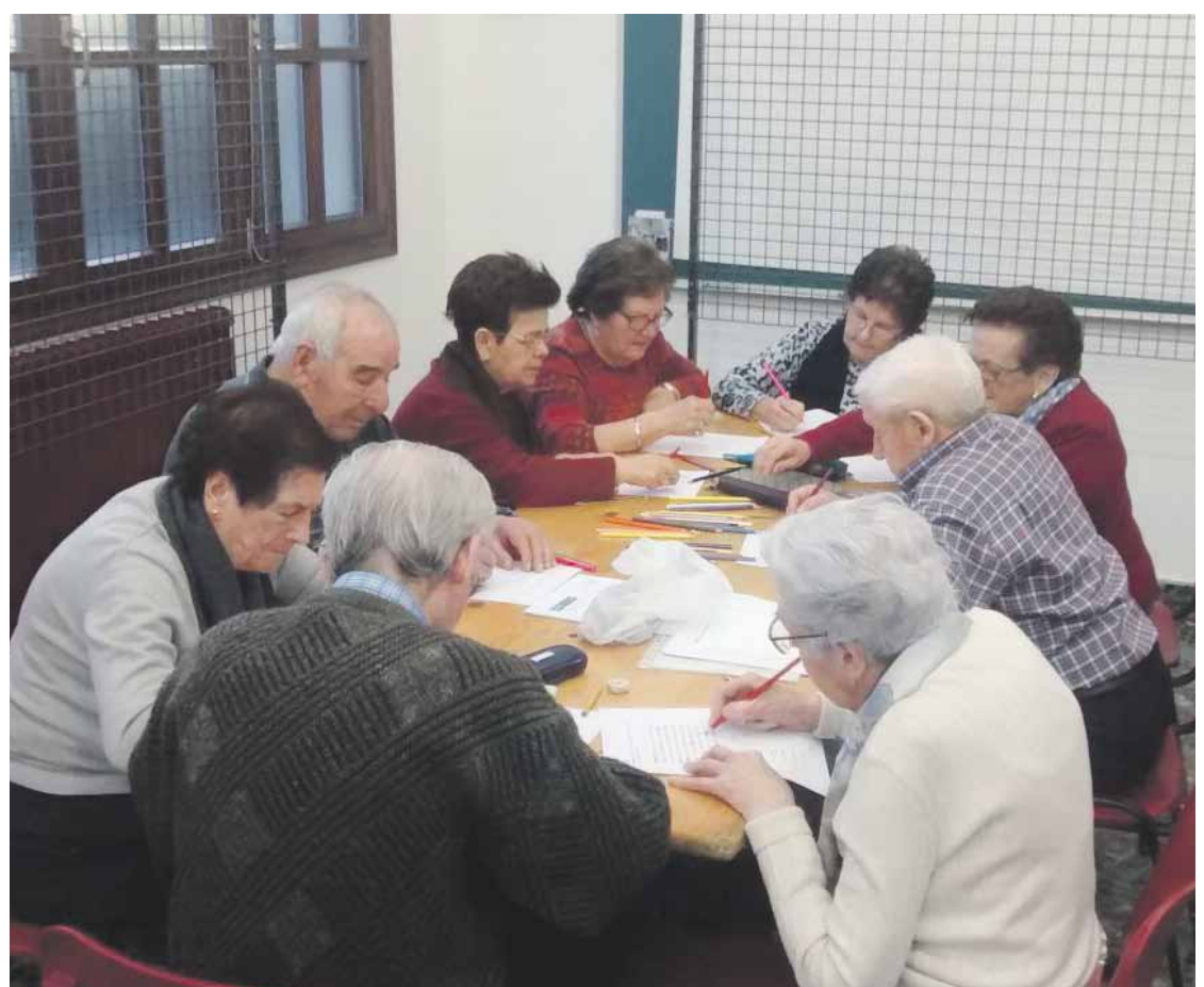
Asteon Zaldibarko Nagusilagun taldean ateratako argazkia.

%70,76 ez dira bakarrik bizi, eta egunero irteten dira etxetik. Hala ere, duten adinarengatik edo osasun arazoengatik, %21,20k bakarrik parte hartzen du beste ekintza batzuetan.