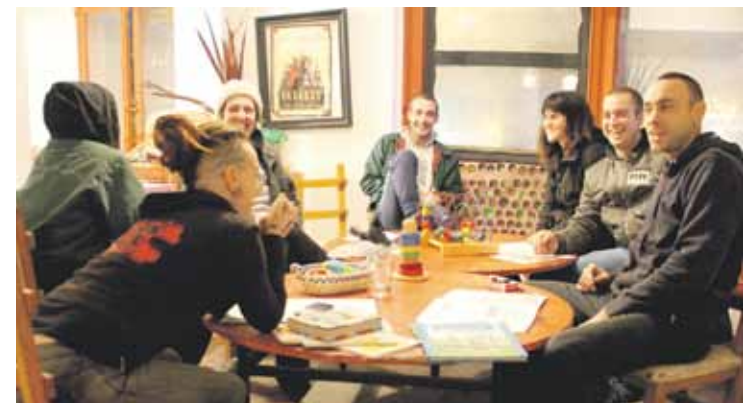
Sapuetxeok hainbat kide, eguaztenean.