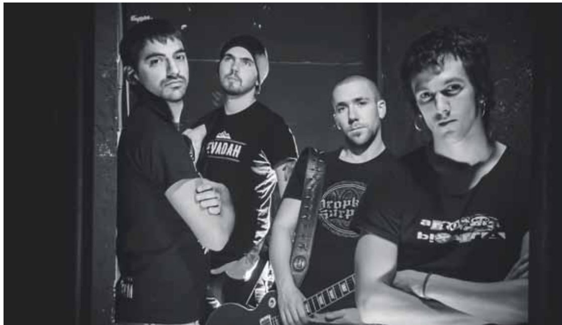
Aurretik Iheskide, Pixontxis edota Kruders taldeetan ibilitako musikariak elkartu dira Bultz! talde berrian.

proiektua gauzatzen laguntzeko aukera. Asteon, finantziario kanpaina helburutzat ipini duten 5.000 euroko kopurua