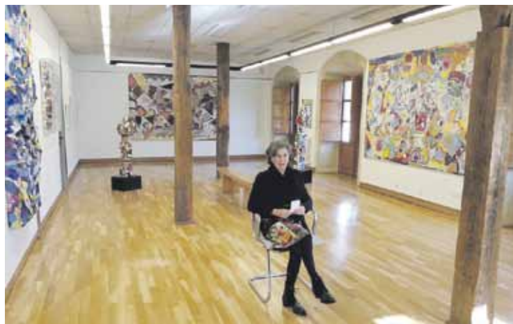
Urtarrilaren 8ra arte dago Etxebertzen lana Durangon ikusgai.

Elorrion eta Durangon daude arte erakusketak