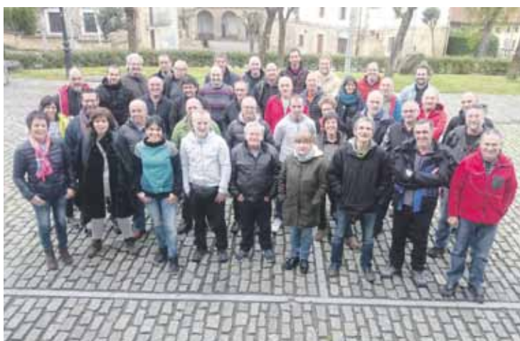
Apirilean preso en kolektiboaren pausoak babestu zituzteneko talde argazkia.

zarteratzera; eztabaida ematen den bitartean, desitxuraketarik egon ez dadin babesa ematea.