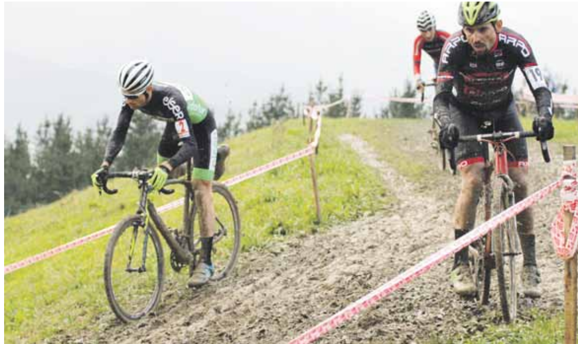
Maila denak kontuan hartuta, 300 bat parte-hartzaile batzea itxaroten dute antolatzaileek. Maialen Zuazubiskar

Parte-hartzaileen kopuruak zein mailak gora egin dutela nabarmendu dute