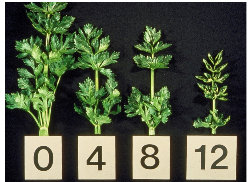
Figura 1. Efectos osmóticos que muestran un crecimiento reducido del apio cuando el EC de las sales agregadas en el agua del suelo se incrementan de 0 a 12 dS/m.

La tolerancia a la sal se basa en la habilidad del cultivo para mantener su producción y calidad a pesar de un incremento en la salinidad. La tolerancia de los cultivos a la sal puede ser descrita como una función de la reducción de productividad a lo largo de un rango de concentraciones de sal expresadas como la salinidad