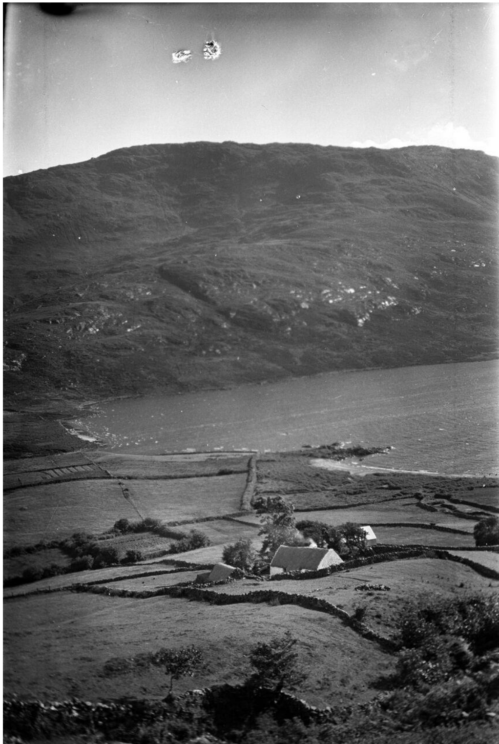
Seanadh Farracháin, An Fhairche, Co. na Gaillime, 1935 CBÉ A015.01.00201