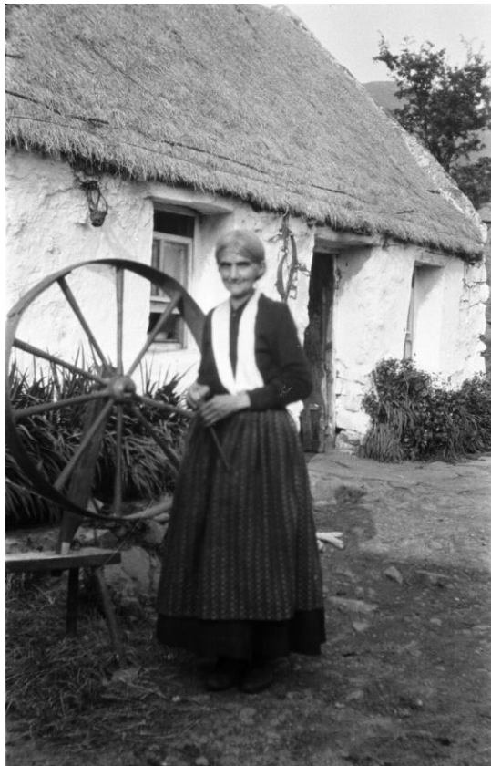
Sníomhadóir agus Tuirne, an Mám, 1935 37