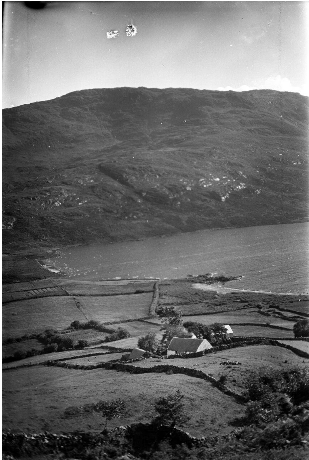
Seanadh Farracháin, An Fhairche, Co. na Gaillime, 1935