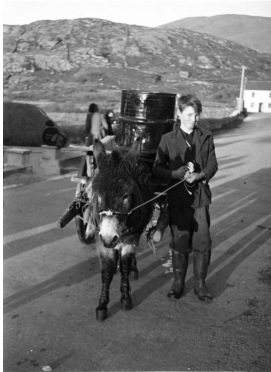
Ag Tarraingt Uisce, Corr na Móna, Samhain 1955