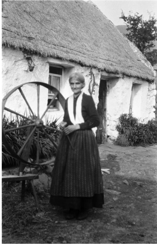
Sníomhadóir agus Tuirne, an Mám, 1935 37