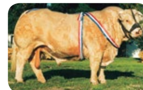
RELIEF - Irmão paterno