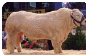
MAJOR - Pai

Peso ao Nascer: 54 kg Peso 205 dias: 427 kg Peso 365 dias: 695 kg Peso Adulto: 1.285 kg Comprimento: 210 cm Altura: 160 cm Perímetro Torácico: 250 cm Comp. Bacia: 75 cm CE: 52 cm