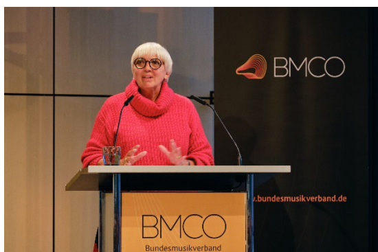
Kulturstatsministerin Claudia Roth MdB richtete ein Grußwort an die Gäste des Parlamentarischen Abends der Amateurmusik

https://login.yoursecurecloud.de/f/d7d6a903df544005b038/