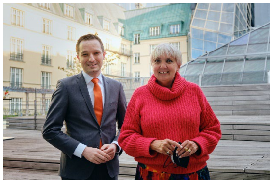
BMCO-Präsident Benjamin Strasser MdB und Kulturstatsministerin Claudia Roth MdB