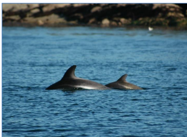
Fotografía de Lagenorhynchus australis (Izq.: Frederick Toro; Der.: Marjorie Fuentes)