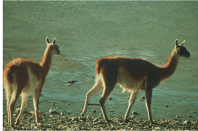
Fotografía de Lama guanicoe guanicoe (A. Iriarte en: Muñoz-Pedrerros & Yáñez 2000)