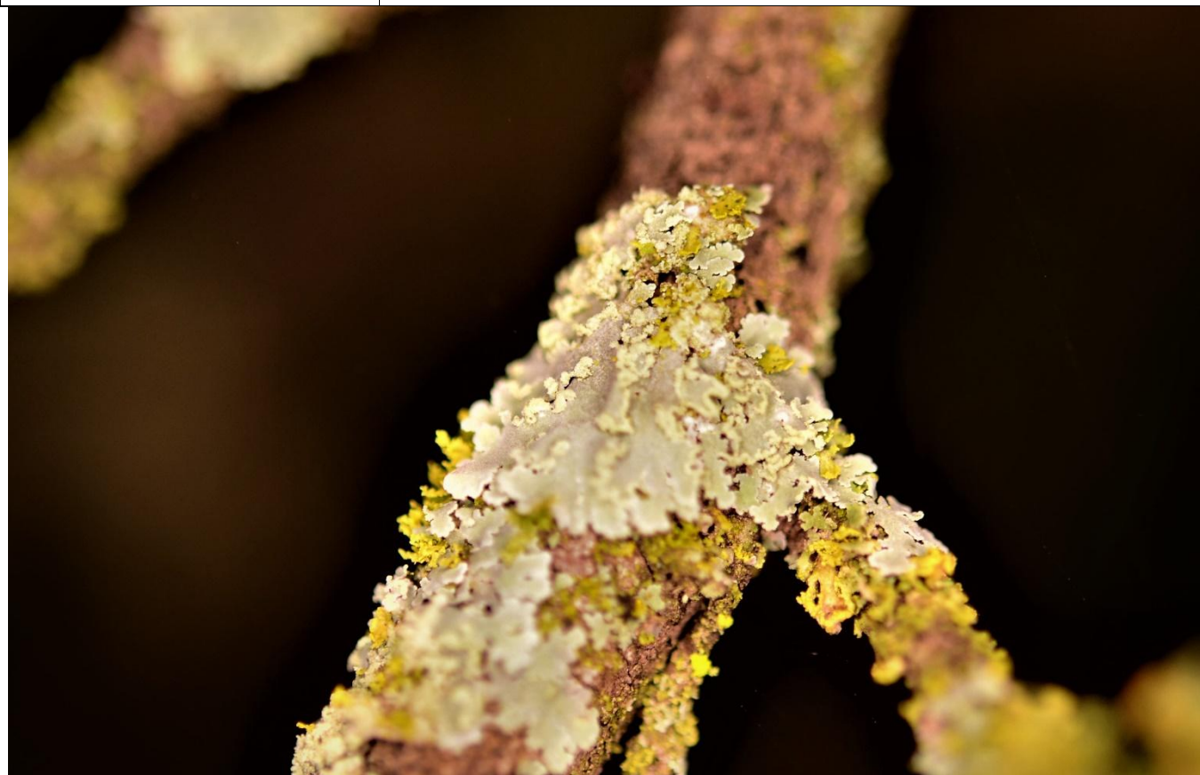
Fotografías de Hyperphyscia adglutinata, Altos de Cantillana