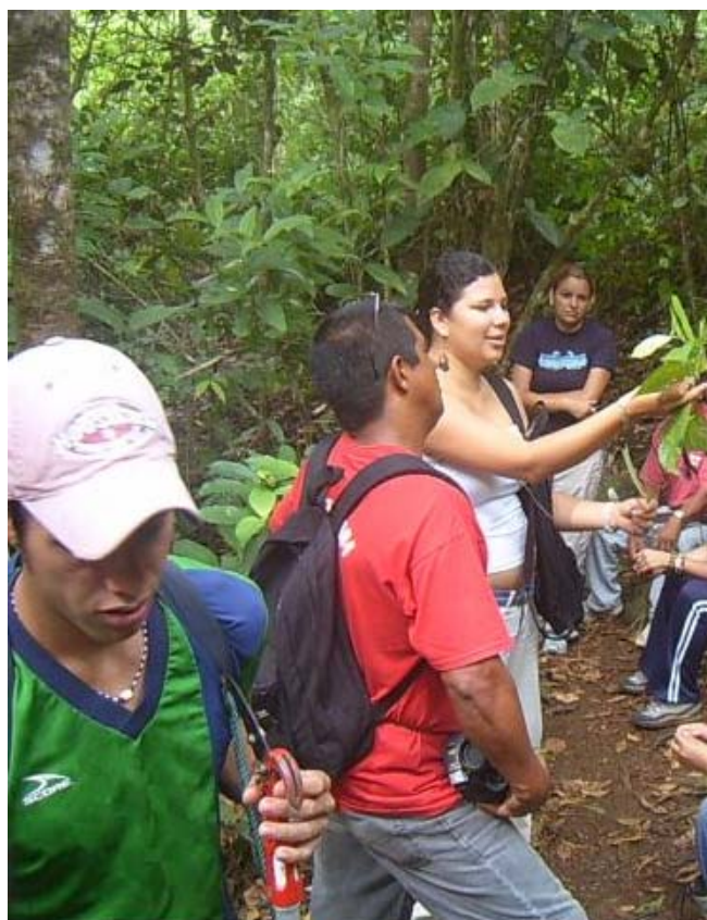
Colecta de muestras botánicas en bosque comunal

Este estudio tuvo como objetivo realizar una valoración preliminar de la riqueza florística que se conserva en los bosques comunales de asentamientos campesinos de altura. Nos propusimos utilizar los datos de riqueza biológica tanto como un indicador de la riqueza biológica que todavía se encuentra en estos bosques como también para aprovecharse como herramienta educativa y atractivo ecoturístico. Para esto, identificamos los elementos de la flora que fueran mas comunes, que tuvieran usos importantes o con se encontraran con algún grado de amenaza a nivel nacional, poniendo especial atención en los árboles presentes. Se identificó los principales elementos de la flora a lo largo