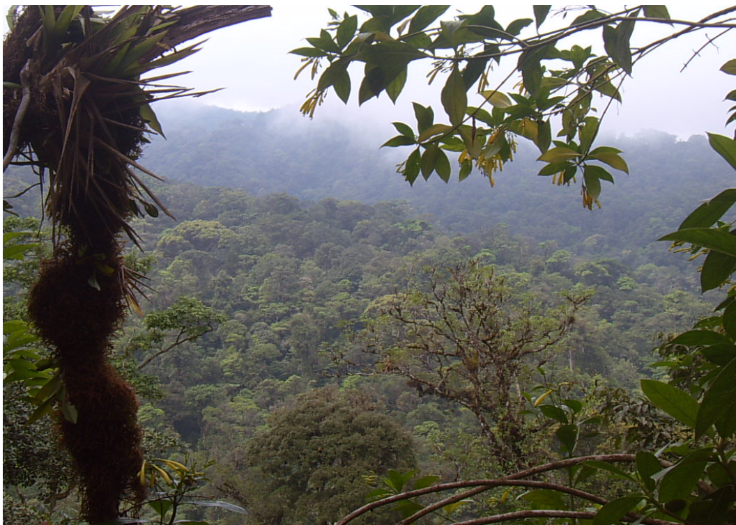
Bosque comunitario del asentamiento campesino Garabito y Parque Nacional del Agua al fondo, marzo, 2005

ASENTAMIENTO CAMPESINO AGROINDUSTRIAL SUR DE BUENOS AIRES DE DOS RÍOS DE UPALA Y ASENTAMIENTO GARABITO, AGUAS ZARCAS DE SAN CARLOS, ZONA NORTE, COSTA RICA