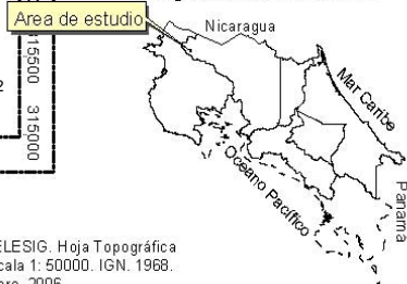
Diagrama de ubicación