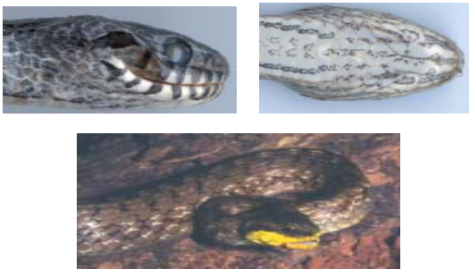
Figura 3 - Detalhes da cabeça de Thamnodynastes spp. (A) Thamnodynastes strigatus (IB 64113), vista lateral direita; (B) Thamnodynastes hypoconia (IB 54020), vista ventral; (C) Thamnodynastes rutilus , exemplar adulto, Presidente Epitácio, SP (Rio do Peixe).

gular e mentoniana com manchas, enquanto T. almae sp. nov. apresenta região gular imaculada (Figura 2C). Distingue-se de Thamnodynastes sp. 1 pelo dorso mais escuro e o ventre lineado, que escurece gradativamente em direção à cloaca; T. almae sp. nov. é extremamente clara, com ventre lineado homogêneo, que não escurece em direção à cloaca (Figura 1B). Distingue-se de Thamnodynastes sp. 2, pois esta apresenta regiões mentoniana e gular com manchas escuras e escamas subcaudais em número igual ou maior a 59 (SC, X = 50,2, DP = 3,86, N = 14), enquanto T. almae sp. nov. apresenta regiões gular e mentoniana imaculadas (Figura 2C) e escamas subcaudais em número igual ou inferior a 57 (SC, X = 62,6, DP = 3,51, N = 3) (Tabela 2).