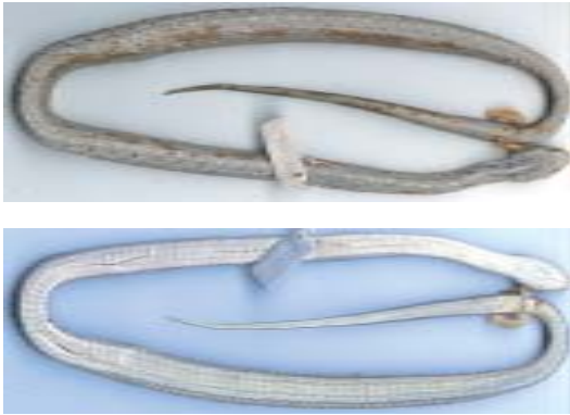
Figura 1 - Thamnodynastes almae sp. nov. (Holótipo, IB 52135). A) vista dorsal, B) vista ventral.