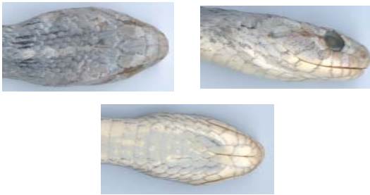
Figura 2 - Cabeça de Thamnodynastes almae sp. nov. (Holótipo, IB 52135). A) vista dorsal, B) vista lateral direita, C) vista ventral.