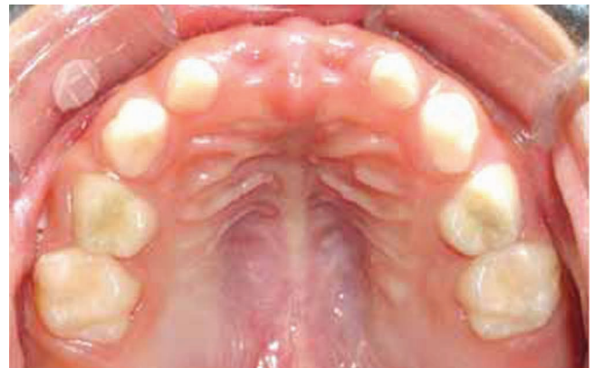
Figura 3. Oclusal superior. Dentición temporal libre de caries y ausencia de diente 51 y 61.

Tomando en cuenta el diagnóstico de base del paciente y encontrando los hallazgos clínicos reportados