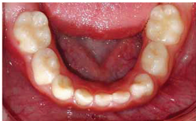
Figura 7. Oclusal inferior. Dentición temporal libre de caries. Fusión de diente 72 y 73.

en la literatura, se decide realizar los tratamientos recomendados por los diversos autores.