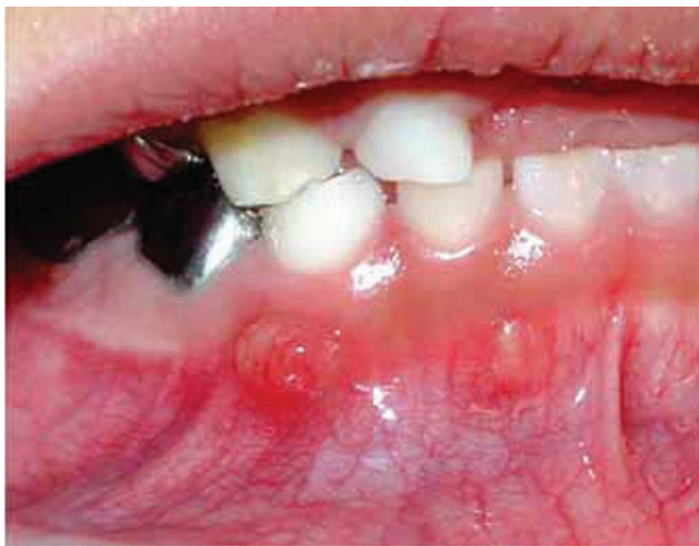
Figura 9. Absceso periapical en dientes 82 y 83.

Nuestro paciente presentó abscesos periapicales en los dientes 51 y 61; varias ocasiones que, según la madre, fue en ausencia de caries o trauma, y durante la exploración se observaron fístulas a nivel de los dientes 64 y 54 con salida de material purulento; sin embargo, no presentaban procesos cariosos ni cambio de color que nos indicara antecedentes de traumatismo dental. En cuanto a las cámaras pulpares agrandadas con cuernos que llegan hasta la unión amelodentinaria, fueron observadas en las ra-