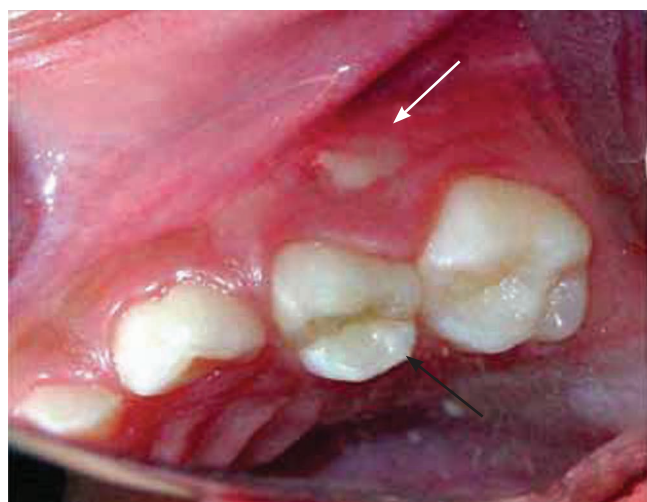
Figura 6. Lateral izquierda. Fístula a nivel de diente 64 (flecha blanca) y ausencia de caries (flecha negra).