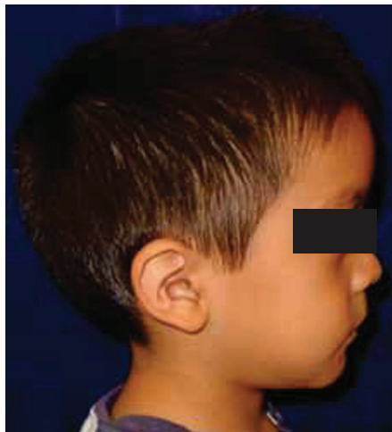
Figura 2. Abombamiento del hueso frontal por sinóstosis de sutura sagital.

dentarios afectados se encontraban libres de caries (Figuras 5 y 6).