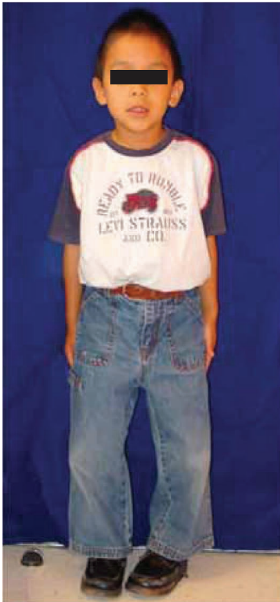
Figura 1. Arqueamiento de extremidades inferiores.

Presencia de fístulas a nivel de diente 54 y 64 con salida de material purulento; sin embargo, los órganos