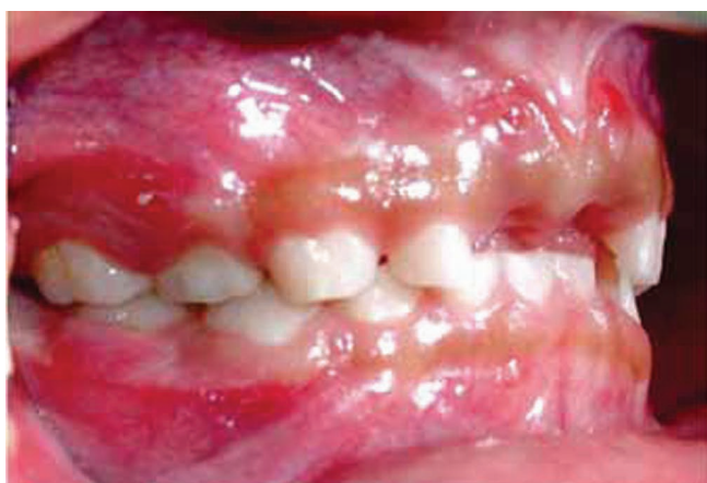
Figura 5. Lateral derecha. Fístula a nivel de órgano dentario 54 (flecha).