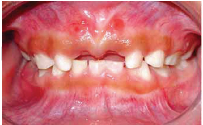
Figura 4. Vista anterior. Cicatrices de fístula en encía insertada a nivel de dientes 51 y 61.