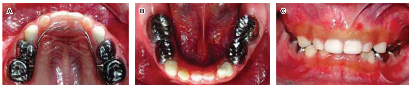
Figura 11. A, B, C. Fotografías finales anterior y oclusales Restauraciones con coronas de acero cromo en molares, resinas en caninos y frente estético.