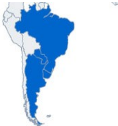
Obrázek 3.7. MERCOSUR