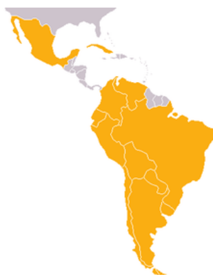
Obrázek 3.2. ALADI