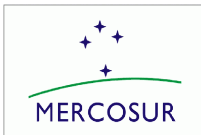
OBRÁZEK 3.4. LOGO MERCOSUR