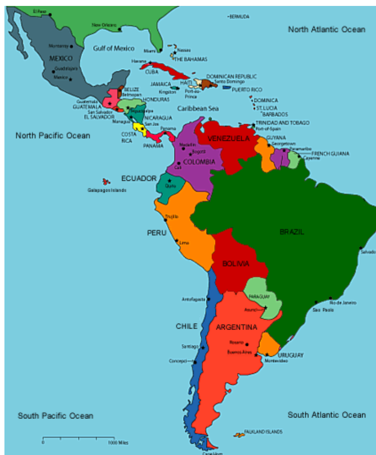
Obrázek 3.1. Latinská Amerika