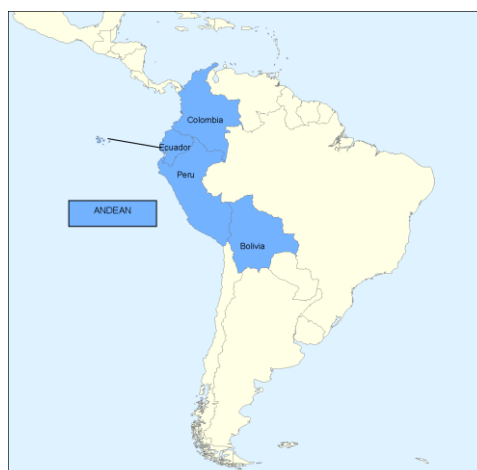
Obrázek 3.6. ANCOM