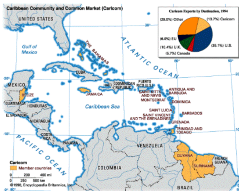
Obrázek 3.5. CARICOM