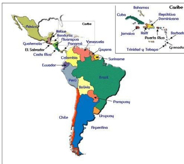
Obrázek 3.3. SELA

Zdroj: převzato z http://www.tiptopglobe.com/big-photo/sistema-economico-latinoamericano-2.jpg