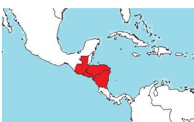
Obrázek 3.4. CACM