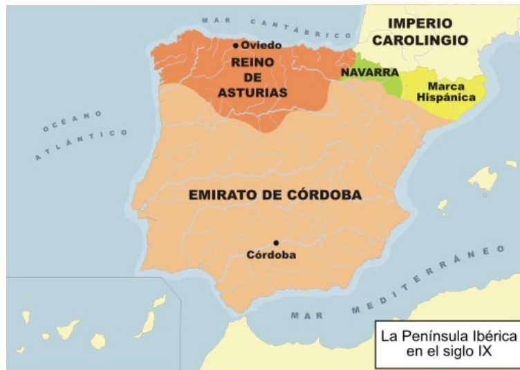
Imagen de José Alberto Bermúdez en Banco de imágenes y sonidos de intef (modificada). Licencia CC BY-NC-SA