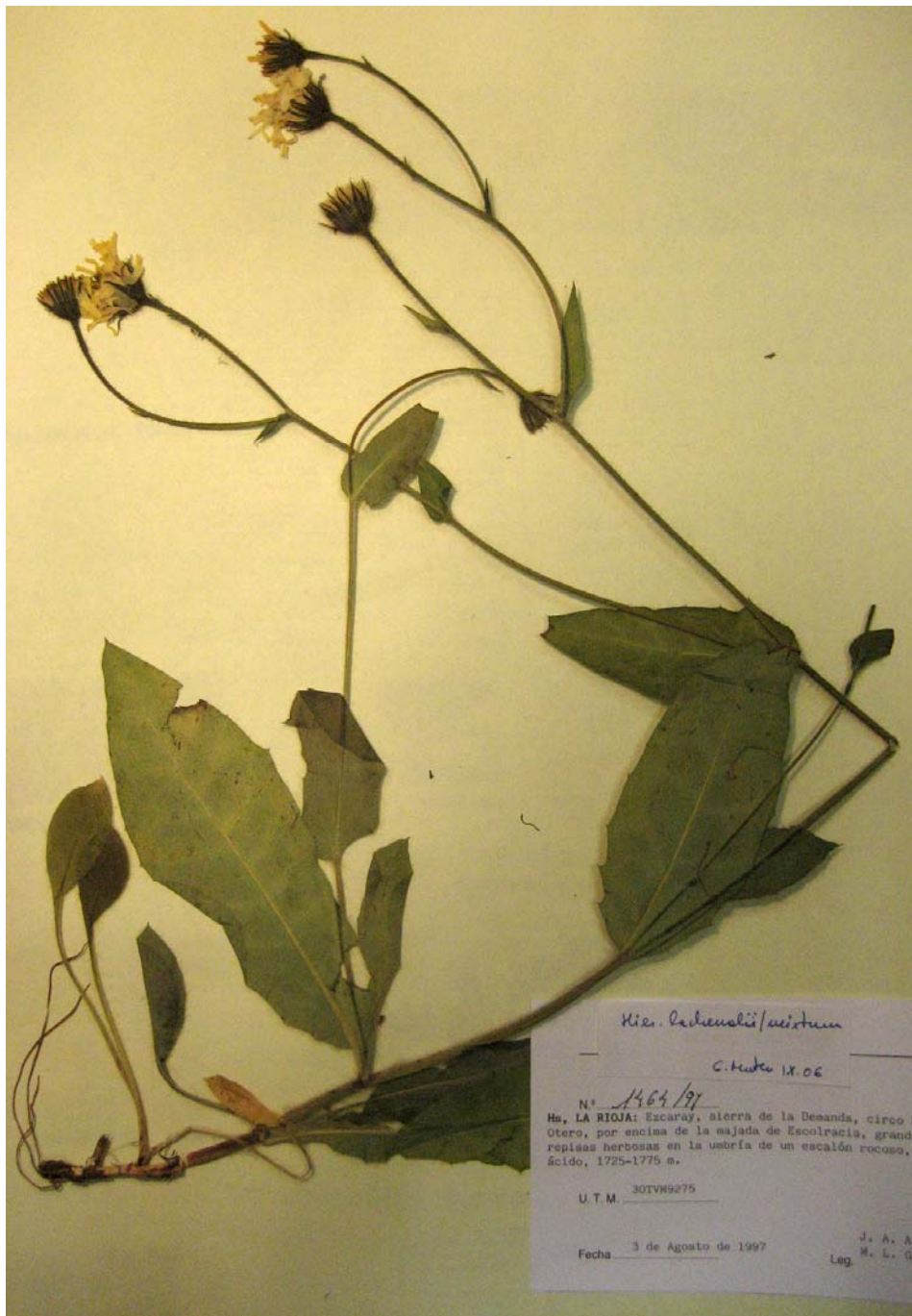
Typus de Hieracium latemixtum