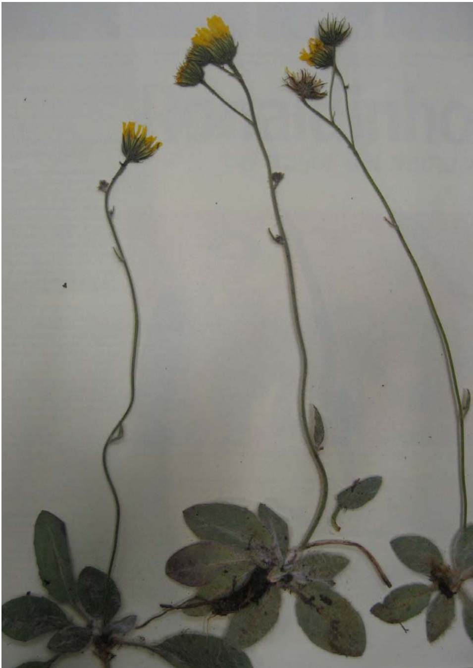
Typus de Hieracium cistiernense