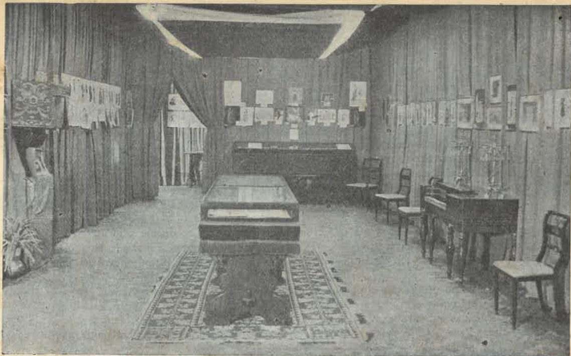
Un rincón de la Exposición.