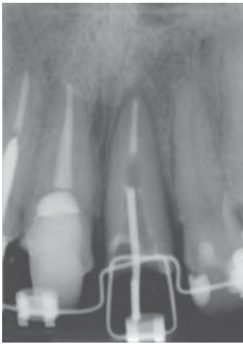
Figura 5. Radiografía periapical del seguimiento 2