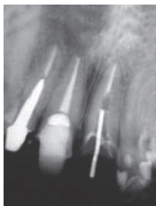
Figura 2. Radiografía periapical del estado inicial del diente