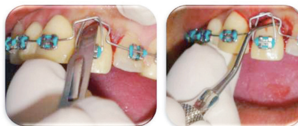
Figura 4. Fibrotomía supracrestal