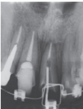
Figura 7. Radiografía periapical del seguimiento 4