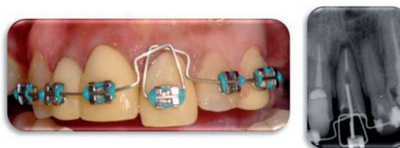
Figura 3. Fotografía y radiografía periapical del seguimiento 1