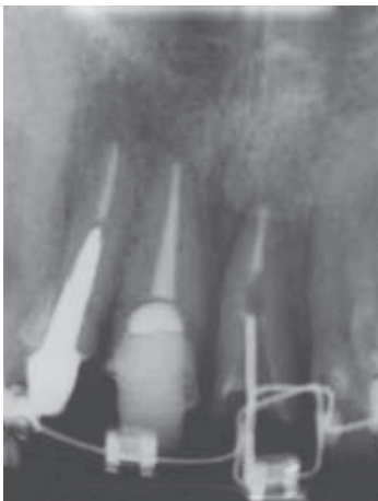
Figura 6. Radiografía periapical del seguimiento 3