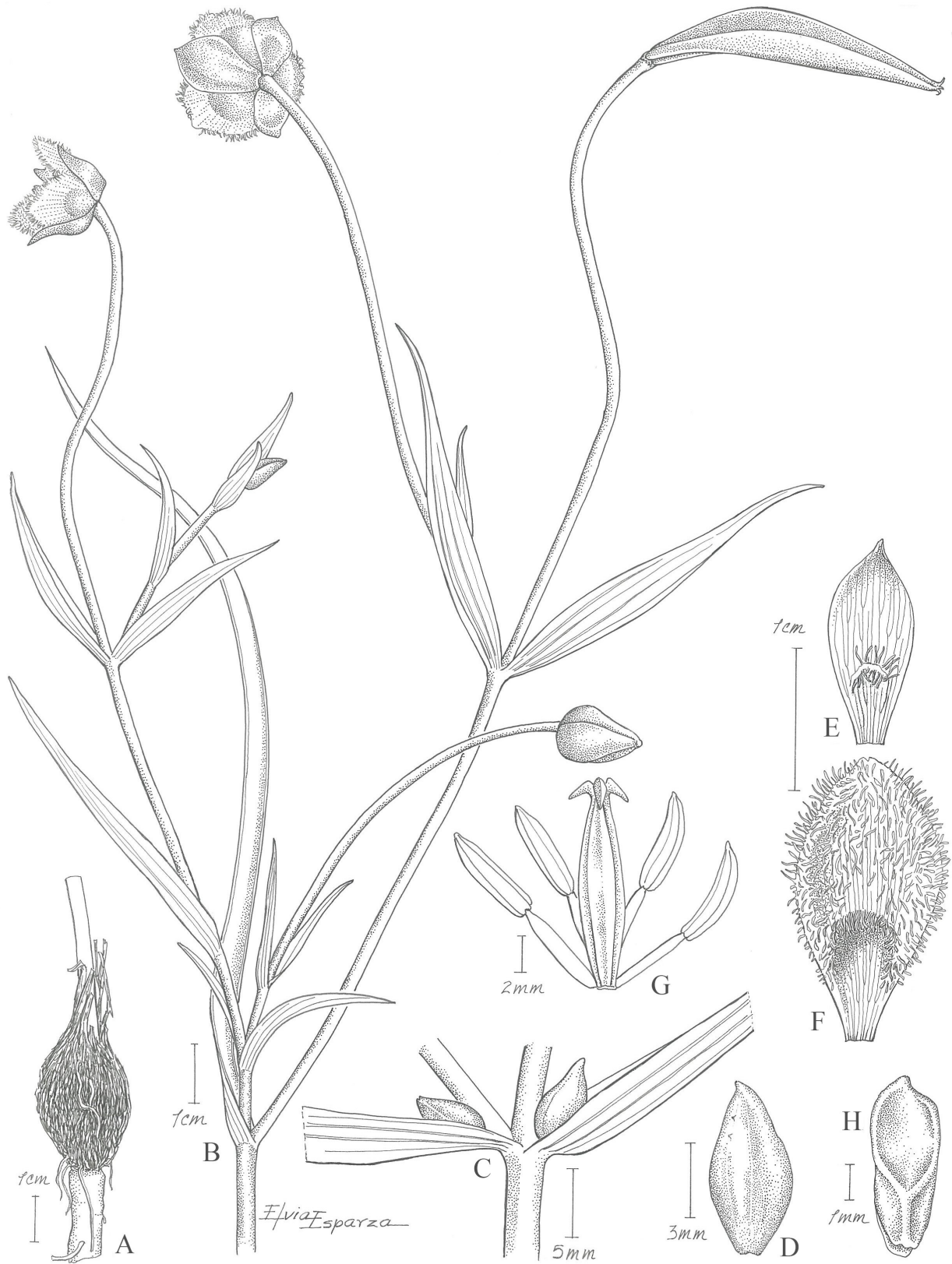
Figura 1: Calochortus multicolor García-Mend., D. Sandoval & Chávez-Rendón. A. bulbo; B. hábito; C. bulbilos en las axilas de las hojas; D. bulbilo, E. sépalo; F. pétalo; G. androceo y gineceo; H. semilla.