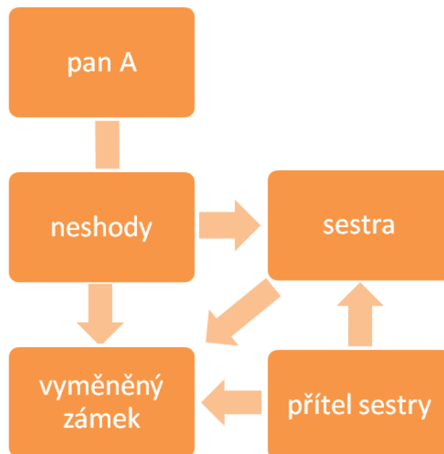
Obrázek 1. Příčina bezdomovectví pana A

Výsledky výzkumu jsem graficky znázornila na následujících obrázcích: